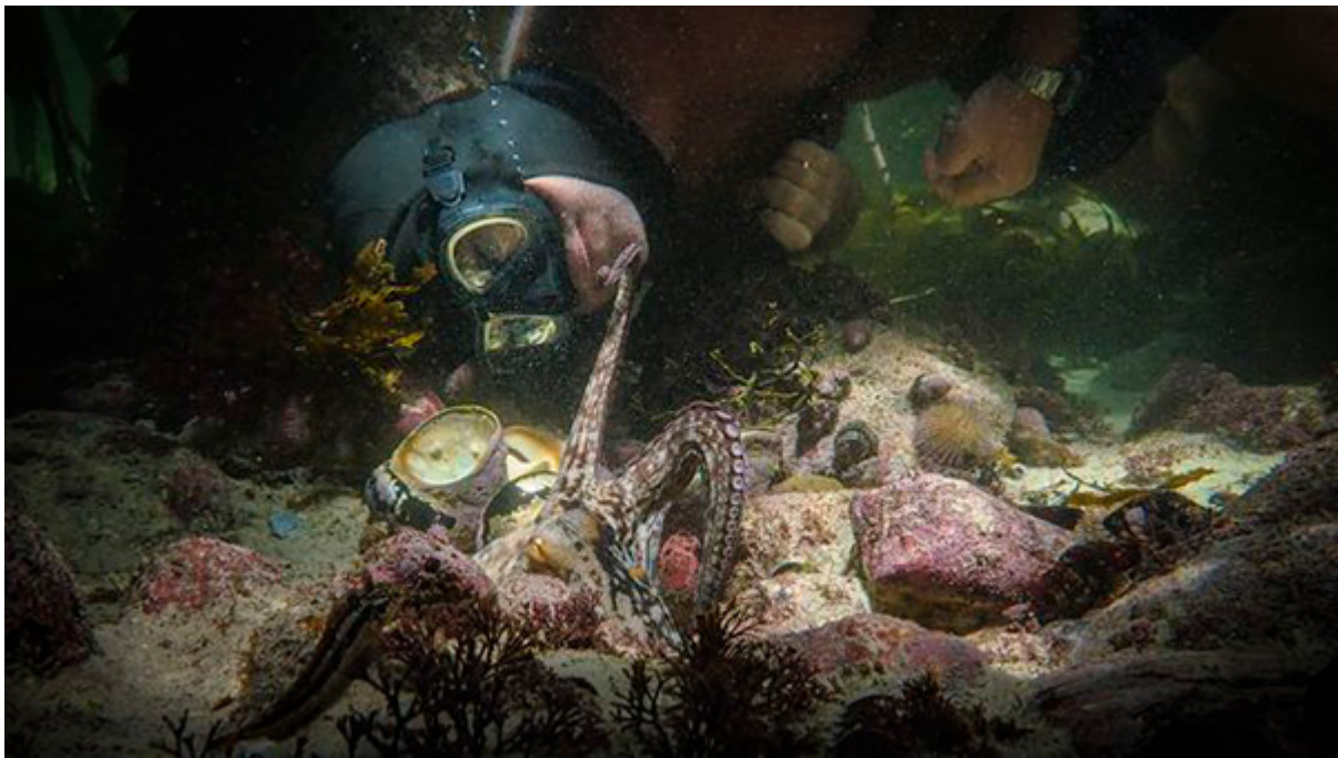
<백지 이주연>, 백지이주연 90 , 2020 (장르: 다큐멘터리)

백지이주연 다큐멘터리 백지이주연 90 는 백지이주연의 삶과 예술 세계를 다룬다. 백지이주연은 한국 현대미술의 대표 작가로, '백지이주연'이라는 다큐멘터리 시리즈를 통해 자신의 예술 세계를 소개했다. 이 다큐멘터리는 '백지이주연' 시리즈의 90번째 작품으로, 백지이주연의 삶과 예술 세계를 다룬다. 이 다큐멘터리는 '백지이주연' 시리즈의 90번째 작품으로, 백지이주연의 삶과 예술 세계를 다룬다.