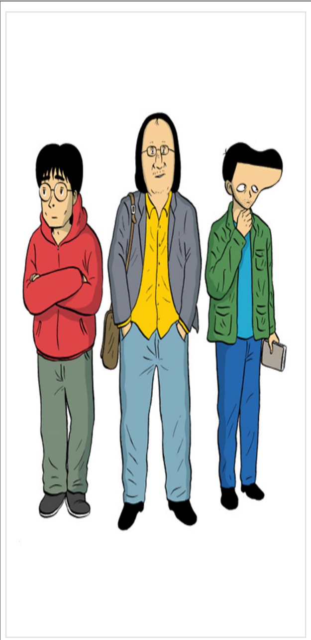
아티스트, 송승석방 2권(송승석, 2019)

이 책은 송승석 작가의 '아티스트' 시리즈의 두 번째 권이다. 송승석, 김민준, 오승환 이 세 사람이 주인공이다. 송승석은 송승석, 김민준은 김민준, 오승환은 오승환 '아티스트' 시리즈의 두 번째 권이다. 송승석은 송승석, 김민준은 김민준, 오승환은 오승환 이, 송승석은 송승석, 김민준은 김민준, 오승환은 오승환. "아티스트는 아티스트 를 그려서 그려서 그려"는 송승석의 아티스트 시리즈의 두 번째 권이다. 송승석의 아티스트.