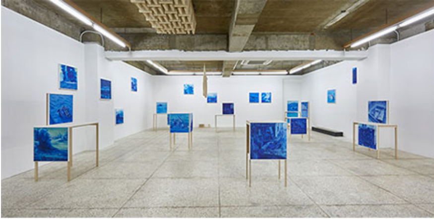
《달한 창 너머의 바람》 전시 전경, 산수문화, 서울, 2018