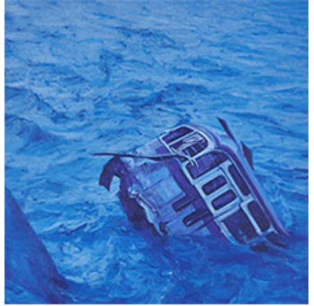
파랑 연작_0510. 종이에 오일파스텔, 50×50cm, 2018

Q. 000 0000 000 00 000 0000 00 000 00 00 00.