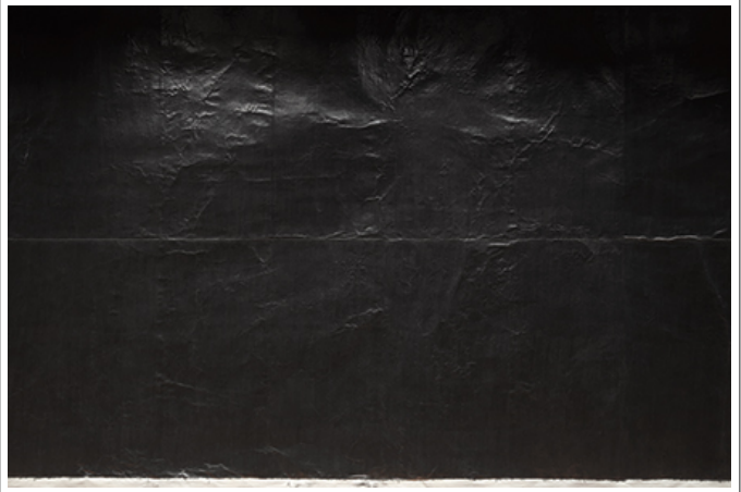
Moments 2017, 285x5400cm, 2017