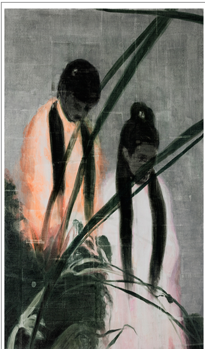
王蒙, 两图, 145×112cm, 2020

‘两图’是王蒙2020年创作的一幅油画，画面中两位人物，一男一女，身着传统中式服饰，低头注视着面前的一株大型植物。画面色调偏暗，以灰绿色为主调，人物衣物的白色与黑色线条形成对比。王蒙在这幅作品中，通过细腻的笔触和光影的运用，营造出一种静谧而深沉的氛围。