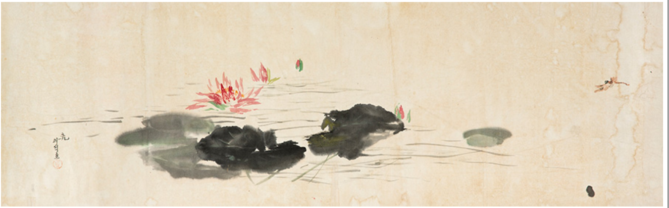
圖 3. 李元, <荷>, 98×30.5cm, 1959年

李元先生自幼隨父習畫，擅山水、花鳥、人物。其畫風深受傳統中國畫影響，注重筆墨的運用與意境的營造。圖3《荷》為其代表作之一，以簡潔的線條與大塊的墨色，勾勒出蓮花葉片的沉鬱與蓮花綻放的生機。畫面構圖疏密有致，墨色濃淡相宜，展現了蓮花高潔脫俗的氣質。此作不僅是李元先生對自然景觀的寫真，更是其深厚藝術修養的體現。