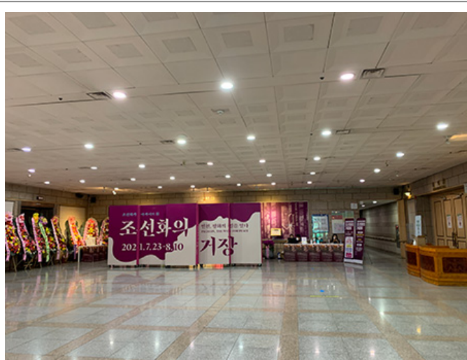
전시 1. 조선화 전시회 '조선화' 전시회 전시회

조선화 전시회 전시회 전시회 전시회 전시회 전시회. 조선화 전시회 전시회 전시회 전시회 전시회 전시회 전시회(전시 1). 조선화 전시회, 조선화 전시회 전시회 전시회 전시회, 조선화 전시회 전시회 전시회 전시회 전시회 전시회. 조선화 전시회 전시회 전시회 전시회 전시회 전시회. '조선화 전시회 전시회', 조선화 전시회 전시회.