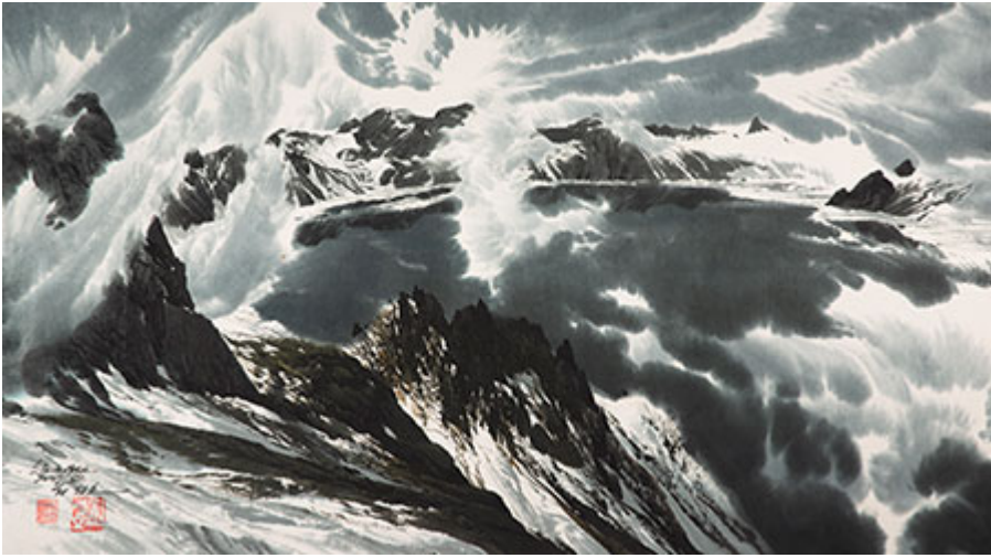
작품 7. 산경, <5월 산경>, 134×75cm, 수묵화, 2008년