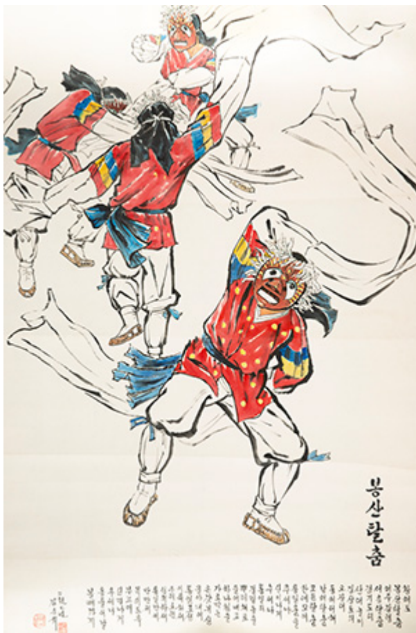
작품 8. 탈춤, <탈춤>, 151×101cm, 수묵화, 2007년

본 작품은 전통적인 한국화 기법인 수묵화를 바탕으로, 현대적인 감각과 표현 방식을 도입하여, 새로운 시각과 감성을 제시하고자 하였다. '탈춤'이라는 소재를 통해, 전통적인 민중문화의 정수를 재현하고, 이를 통해 현대인의 정서와 감성을 표현하고자 하였다. 또한, '탈춤'이라는 소재를 통해, 전통적인 민중문화의 정수를 재현하고, 이를 통해 현대인의 정서와 감성을 표현하고자 하였다.