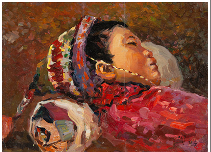
圖 5. 李元, <女像>, 34.5×25cm, 1967年