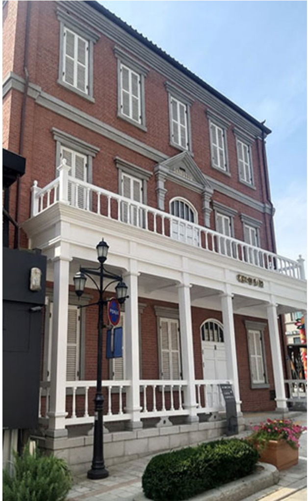
年 月 日