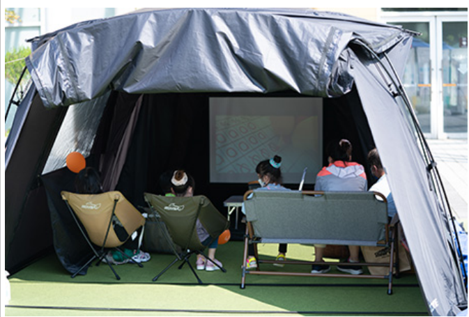
08 프로젝트 (2020. 9. 18. ~ 9. 22.)