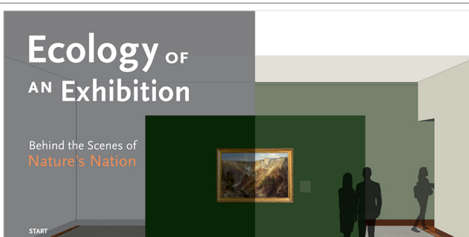
Ecology of an Exhibition 展覧会 https://artmuseum.princeton.edu/ecologyofanexhibition/

展覧会に関する情報は、<環境展 2017-2021> (2021) のウェブサイト（ https://artmuseum.princeton.edu/ecologyofanexhibition/ ）や、<環境展 環境問題に関する展覧会> (2020) のウェブサイト（ https://galleryclimatecoalition.org/ ）から確認することができます。また、環境問題に関する最新のニュースや、環境問題に取り組んでいる企業や個人の話を紹介した。