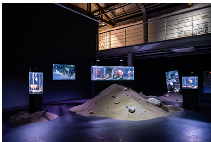
展覧会、<環境展>、2021年、3月、ロックフェラー・ミュージアム（ニューヨーク）にて開催された。

2021年3月、ニューヨークのロックフェラー・ミュージアム（New Rock）にて、環境問題に関する展覧会が開催された。この展覧会は、環境問題の現状と、私たちができることを紹介する。展覧会には、環境問題に関する最新の研究成果や、環境問題に取り組んでいる企業や個人の話が紹介された。また、環境問題に関する最新のニュースや、環境問題に取り組んでいる企業や個人の話を紹介した。展覧会は、環境問題に関する最新の研究成果や、環境問題に取り組んでいる企業や個人の話が紹介された。また、環境問題に関する最新のニュースや、環境問題に取り組んでいる企業や個人の話を紹介した。