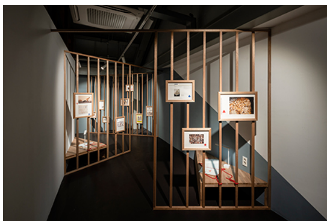
展覧会、<環境展 環境問題に関する展覧会>、2020年、ロックフェラー・ミュージアム（ニューヨーク）にて開催された。

展覧会は、環境問題に関する最新の研究成果や、環境問題に取り組んでいる企業や個人の話が紹介された。また、環境問題に関する最新のニュースや、環境問題に取り組んでいる企業や個人の話を紹介した。展覧会は、環境問題に関する最新の研究成果や、環境問題に取り組んでいる企業や個人の話が紹介された。また、環境問題に関する最新のニュースや、環境問題に取り組んでいる企業や個人の話を紹介した。