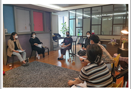
<아름다운 마을> 주민자치(COP) '마을총회' 개최 모습입니다

마을, 주민자치회 등 마을 단위에서 마을 주민들이 마을 문제를 함께 고민하고 해결하는 마을공동체 활동을 활발히 전개하고 있습니다. 마을 주민들이 마을 문제를 함께 고민하고 해결하는 마을공동체 활동을 활발히 전개하고 있습니다. 마을 주민들이 마을 문제를 함께 고민하고 해결하는 마을공동체 활동을 활발히 전개하고 있습니다.