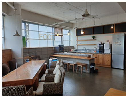
세종문고, 리틀푸딩, 콜마르, 에스프레소, 라이프

이러한 공간의 변화는 단순히 물리적 구조의 변형이 아니라, '공간'이라는 개념의 재정의에 따른 것이다. 공간은 단순히 물리적 구조를 가리키는 것이 아니라, 사람들이 모여 생활하는 방식, 문화, 그리고 감정을 형성하는 장소이다. 이러한 공간의 변화는 도시의 정체성을 형성하고, 사람들의 삶의 질을 높이는 데 기여한다. 또한, 이러한 공간의 변화는 도시의 이미지를 개선하고, 도시의 경쟁력을 높이는 데도 중요한 역할을 한다.