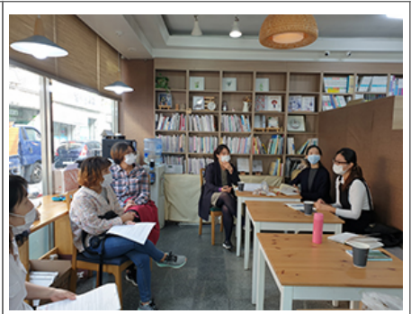
2020 마을공동체 마을공동체

마을 6개 마을공동체 7개 마을 단위에서 마을 주민들이 마을 문제를 함께 고민하고 해결하는 마을공동체 활동을 활발히 전개하고 있습니다. 마을 주민들이 마을 문제를 함께 고민하고 해결하는 마을공동체 활동을 활발히 전개하고 있습니다. 마을 주민들이 마을 문제를 함께 고민하고 해결하는 마을공동체 활동을 활발히 전개하고 있습니다.