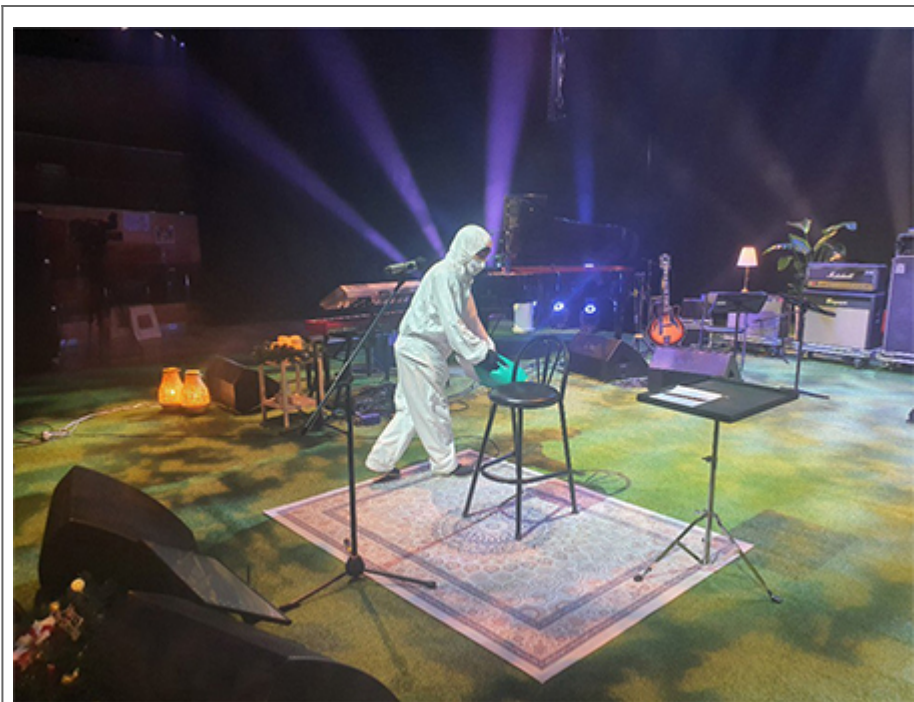
COVID-19 預防 (圖：消毒人員)

COVID-19 的預防方法包括：1. 勤洗手，每次洗手至少 20 秒。2. 避免與他人密切接触。3. 佩戴口罩。4. 避免前往人群密集的地方。5. 避免與有 COVID-19 症狀的人接觸。6. 避免前往室內公共場所。7. 避免前往室內體育館。8. 避免前往室內娛樂場所。9. 避免前往室內會議場所。10. 避免前往室內辦公場所。11. 避免前往室內學校。12. 避免前往室內工作場所。13. 避免前往室內公共場所。14. 避免前往室內體育館。15. 避免前往室內娛樂場所。16. 避免前往室內會議場所。17. 避免前往室內辦公場所。18. 避免前往室內學校。19. 避免前往室內工作場所。20. 避免前往室內公共場所。