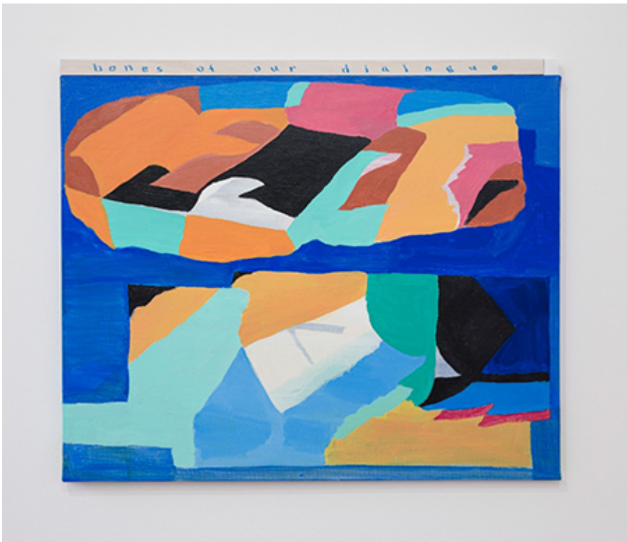
<李健 张 健>, 张健 张健 张健, 张健, 张健, 60.3x52cm, 2019