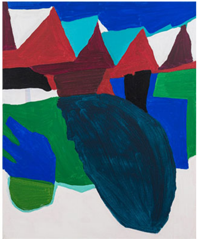
а) <title>, 145.5×130.3cm, 2018/ б) <title>, 60x50cm, 2019

Q. 1990-2000-жылдары Кыргызстандын улуттук сүрөтчүлөрүнүн иштеринин өзгөрүшүнө шарт түзгөн маанилүү факторлорду белгилеңиз.