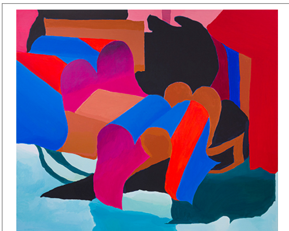
<Q&A 亞洲 藝術 博覽>, 藝術家 作品, 130.3×112.2cm, 2019

2019年，藝術家在台北舉辦了個人首展，展出作品包括《Q&A》、《SeMA》、《OCI》、《Circle to Oval》等。此外，她的作品還曾在多個國際藝術博覽會上展出，包括2018年的「2018 Art4Asia」和「2018 Asia Art Week」。她的藝術風格獨特，色彩鮮艷，充滿了強烈的視覺衝擊力。