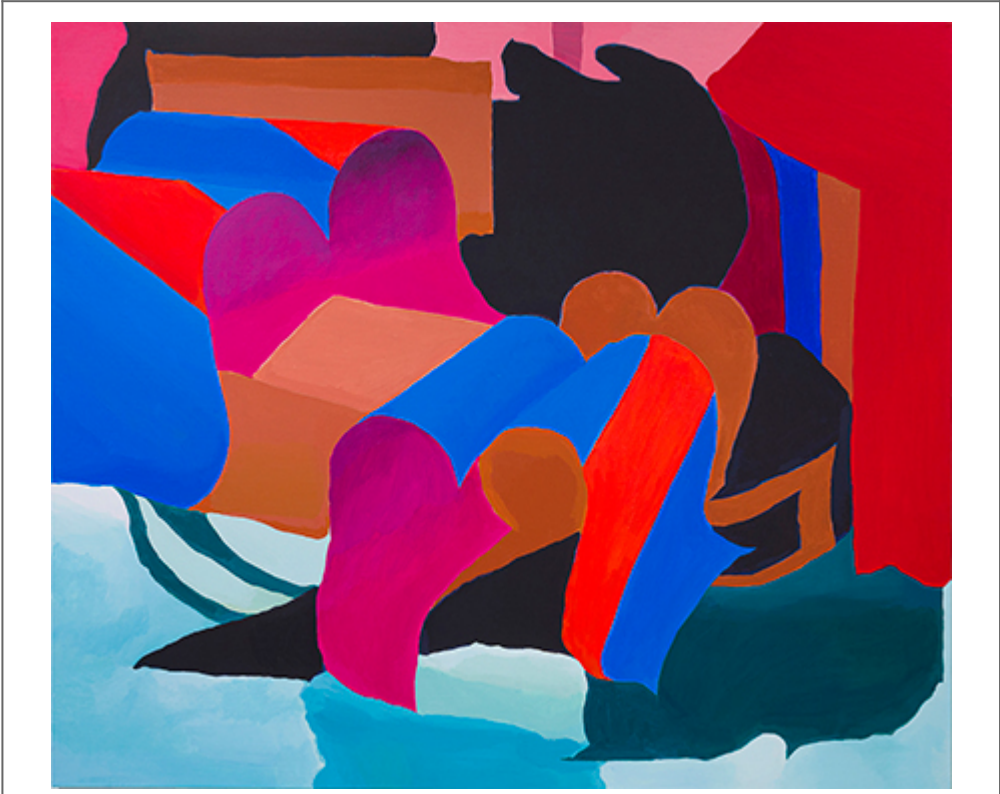
<Circle to Oval>, 王以铸 2019, 130.3×112.2cm, 2019

王以铸毕业于中央美术学院，曾任教于中国美术学院。她曾在中国美术学院任教多年，期间参与了多项艺术项目和展览。她的作品包括《Circle to Oval》、《Fyka Foretold...》、《SeMA》、《OCI》、《Circle to Oval》等。她的作品在国内外多个艺术展览中展出，并获得了多项荣誉。