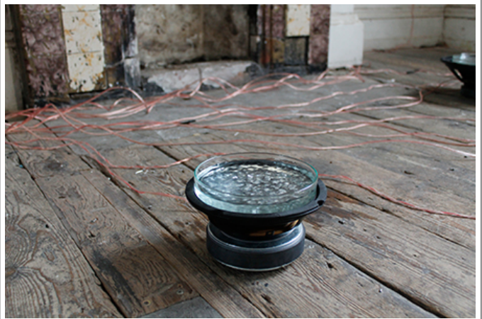
Emergent Vision , Safehouse, 2020