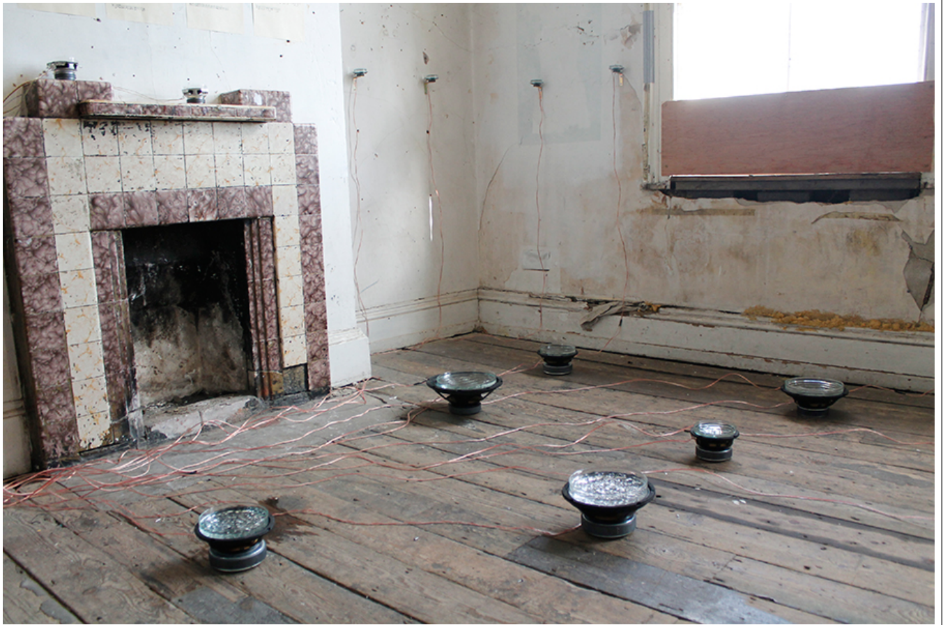
Emergent Vision , Safehouse, 2020