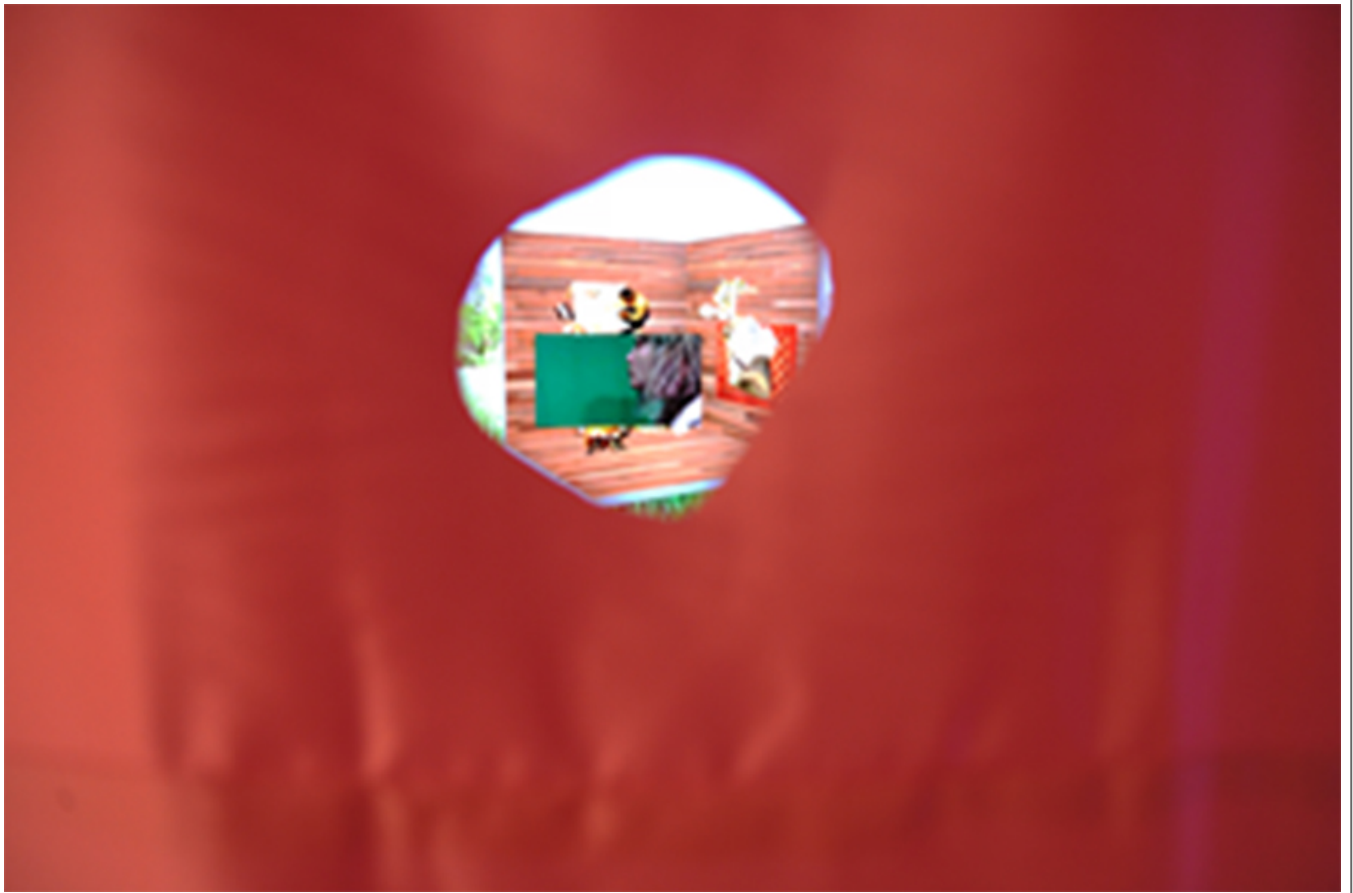
<Untitled>, 2019, 8x48, Rene shin