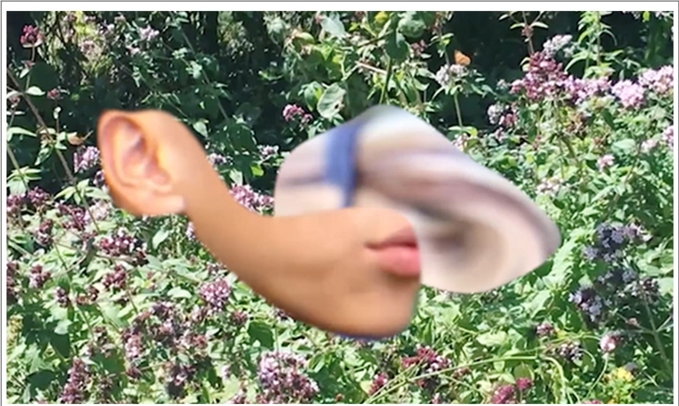
<○○○ ○○○○ ○○○: ○○○ ○○○ Excerpt Image of Make yourself comfortable >, ○○, 4○ 15○, 2018 ○Rene shin

A. <○○○ ○○○○ ○○○ Make yourself comfortable>(2018)○ ○○○○ ○○○○ ○ ○○○○ ○○○○ ○○ ○○○○ ○○○ ○○ ○○○ ○○○○. ○ ○○○ ○○ ○○○○○○○○○ ○○○ ○○○ ○ ○○○○○. ○○ ○○○○○ ○○○○ ○○○○○ ○○○ ○○○○ ○○ ○○○○ ○○○○. ○○, ○○○○○○ ○ ○○ ○○○ ○○ ○○○ ○○○ ○○○ ○○○ ○○○ ○○○○○○ ○○○ ○○○ ○○○○○ ○○○○ ○○○ ○○. ○○○○○○ ○○ ○○ ○○○ ○○ ○○○○○ ○○ ○○○ ○○○ ○○○ ○○○ ○○○○○ ○○○○○. ○○○ ○ ○○○ ○○○ ○○○○ ○○○ ○○○○ ○○○○ ○○○○ ○○○○ ○○○○ ○○○○ ○○○ ○○ ○○○ ○○○ ○○○ ○○○○ ○○○○ ○○○○ ○○○○ ○○○○ ○○○○ ○○○○ ○○○ ○○ ○○○ ○○○ ○○○ ○○○.