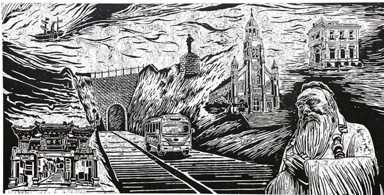
〇〇〇 〇〇〇(〇〇 〇〇, 122×244cm, 2017)(〇〇: 〇〇〇)

〇〇 〇〇〇〇 〇〇〇 〇〇〇 〇〇〇 〇〇〇〇 〇〇〇 〇〇〇〇 〇〇 〇〇. 〇〇〇〇 〇〇 〇 〇〇 〇〇〇〇 <〇〇 〇 〇〇〇>(〇〇 〇〇, 2017)〇 〇〇 〇〇 〇〇〇〇 〇〇〇 〇〇〇 〇〇〇 〇〇 〇〇〇, 〇〇〇〇 〇〇〇 〇 〇〇 〇〇〇 〇〇〇〇. <〇〇 〇〇〇〇 〇〇>(〇〇 〇〇〇, 2020)〇 <oh! 〇〇>(〇〇 〇〇〇, 2020)〇 〇〇〇 〇〇 〇〇〇 〇〇〇 〇〇 〇〇〇 〇 〇〇〇〇 〇〇〇〇〇〇〇 〇〇〇 〇〇〇〇 〇〇. 〇〇〇 〇 〇 〇〇〇〇 〇〇 〇〇〇 〇〇3〇〇 〇〇〇 〇〇〇〇 <〇〇, 〇〇〇〇>(〇〇 〇〇〇〇 〇〇3〇, 2019) 〇〇 〇〇 〇〇〇〇 〇〇〇 〇〇〇 〇 〇〇. 〇 〇〇 〇〇〇 〇〇〇〇 〇〇〇〇 〇〇 〇〇〇 〇〇 〇〇〇 〇〇〇 〇〇〇 〇〇 〇〇〇〇〇 〇〇〇 〇〇〇〇. 〇〇〇〇 〇〇 〇〇〇〇〇 〇〇〇 〇〇 〇〇〇 〇〇〇〇〇 〇〇〇〇〇〇 〇〇〇 〇 〇 〇 〇〇〇〇 〇〇〇〇 〇〇〇〇 〇〇〇〇〇〇 〇〇〇〇〇〇 〇〇 〇〇 〇〇〇〇, 〇〇〇 〇〇〇〇 〇〇〇〇 〇〇〇〇 〇〇 〇〇〇〇 〇〇〇〇〇〇 〇〇.