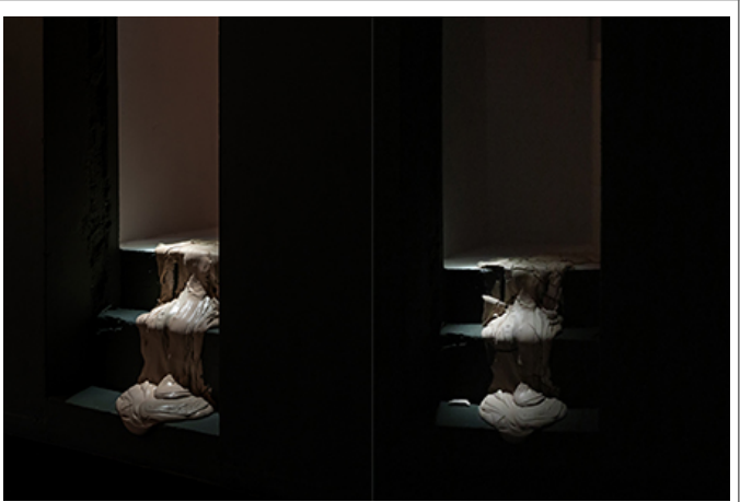
Wet Matter1 ( 김민서, 2017, 610×160×680cm, 2017 ) LED, 물, 흙, 공기, 빛을 주요 재료로 사용하여, 자연의 생명력과 인간의 존재를 탐구하는 작품이다.