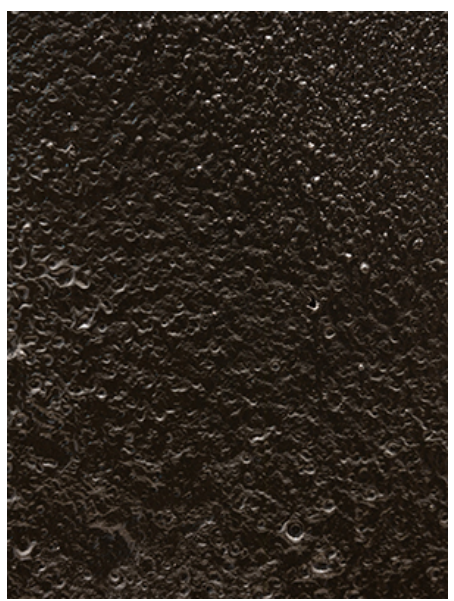
00 00 Wet Matter2 (00 0, 0000, 000000, 505×208×240cm, 2020)