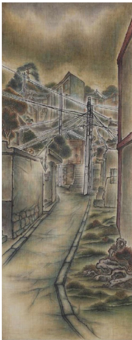
小巷 (小巷 小巷, 小巷, 150x50cm, 2008)