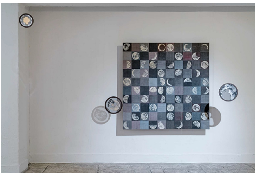
○○○ ○○(○○○ ○○ ○○○, ○○, ○○, 150x150cm, 2015-2016)