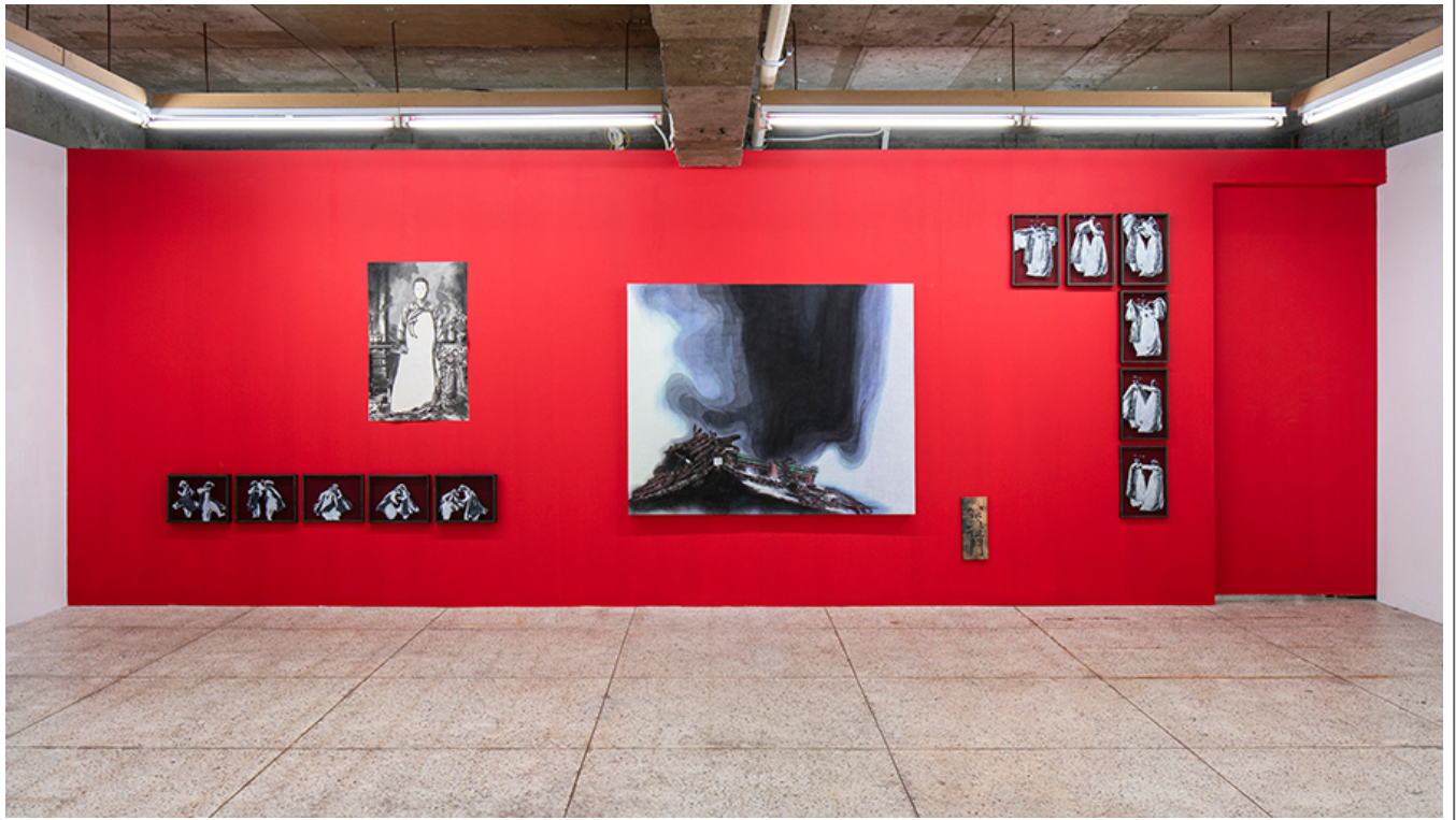
이와서(Sungnyemun)의 전시 공간 (이와서, 2019)