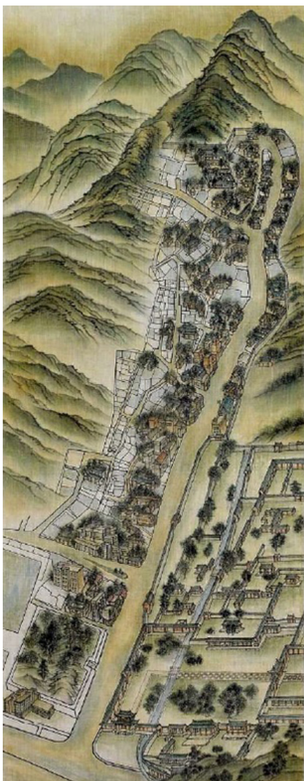
山水 (山水 山水, 山水, 150x50cm, 2007)