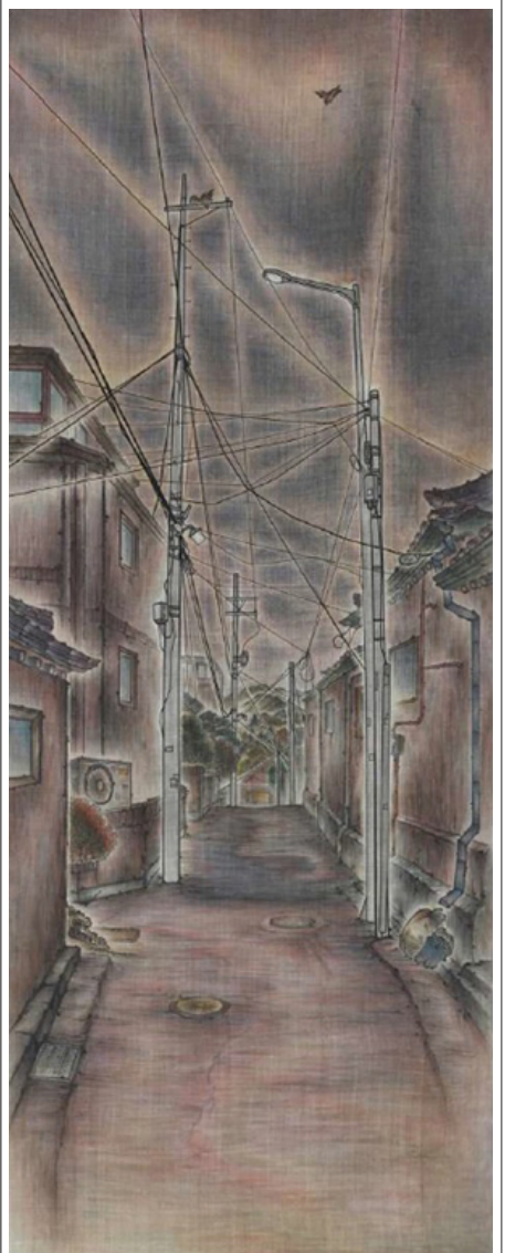
小巷 (小巷 小巷, 小巷, 150x50cm, 2008)