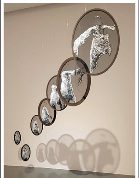
□(○○○ ○○ ○○, ○○○, 2018)

○○○○○ ○○○○ ○○ ○○○ ○○○○ ○○○○ ○○. ○○○ ○ ○○○ ○○○ ○○○○ ○○○○○ ○○. ○ ○ ○○○ ○○○ ○○○○ ○○○○○ ○○ ○ ○○○ ○○ ○○○○ ○○○○○. ○○○ ○○○ ○○ ○○○ ○ ○○○ ○○○ ○○○○ ○○○○. ○○○ ○○○ ○○○ ○○○○, ○○○ ○○○ ○○○ ○○○○○. ○○○ ○○○ ○○○○○○ ○○○, ○ ○○○○ ○○○○ ○○○○○ ○ ○○○.