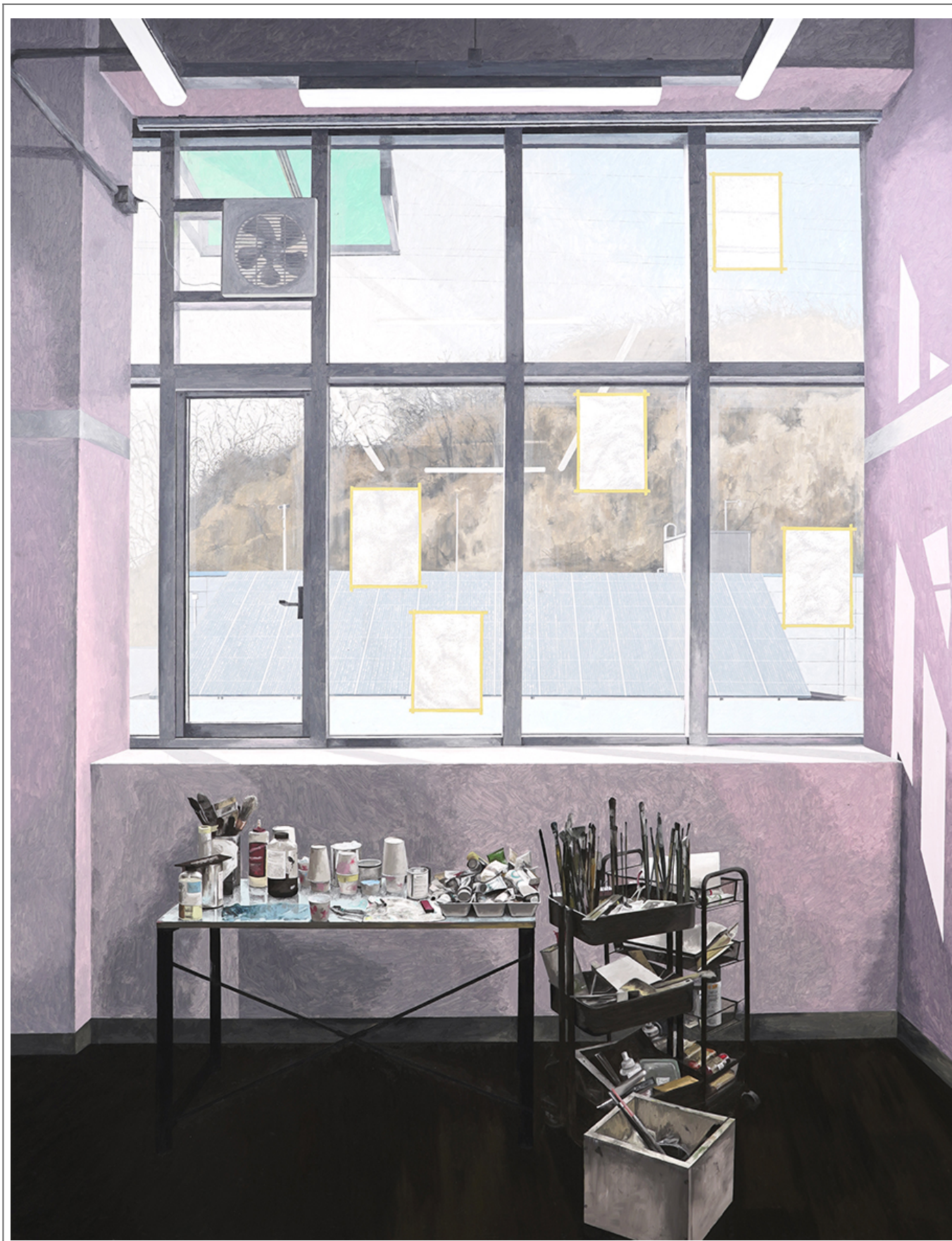
01, 259×193cm, 2019