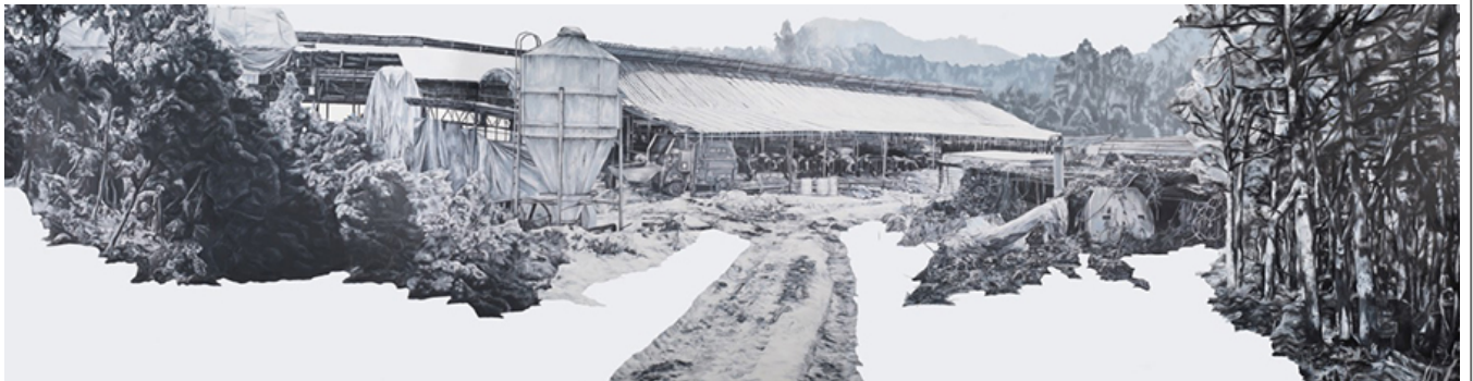
圖1, 890×250cm, 油畫 紙本, 2016

A. 這幅畫作探討了時間與空間的關係。畫中呈現了一個被毀壞的村莊，房屋倒塌，道路斷裂，象徵著災難對人類文明的摧殘。畫家通過對細節的精緻描繪，如廢墟中的瓦礫、倒塌的木樑以及遠處的山巒，營造出一種沉重的悲劇氛圍。這幅作品與OCIA（2016）的創作理念相呼應，強調了對災難後人類處境的關注。此外，畫中隱含的「摺疊時間」(Folded Time)概念，暗示了災難發生前後的時間交錯與空間的扭曲。這幅作品不僅是對災難的記錄，更是對人類命運的深刻反思。