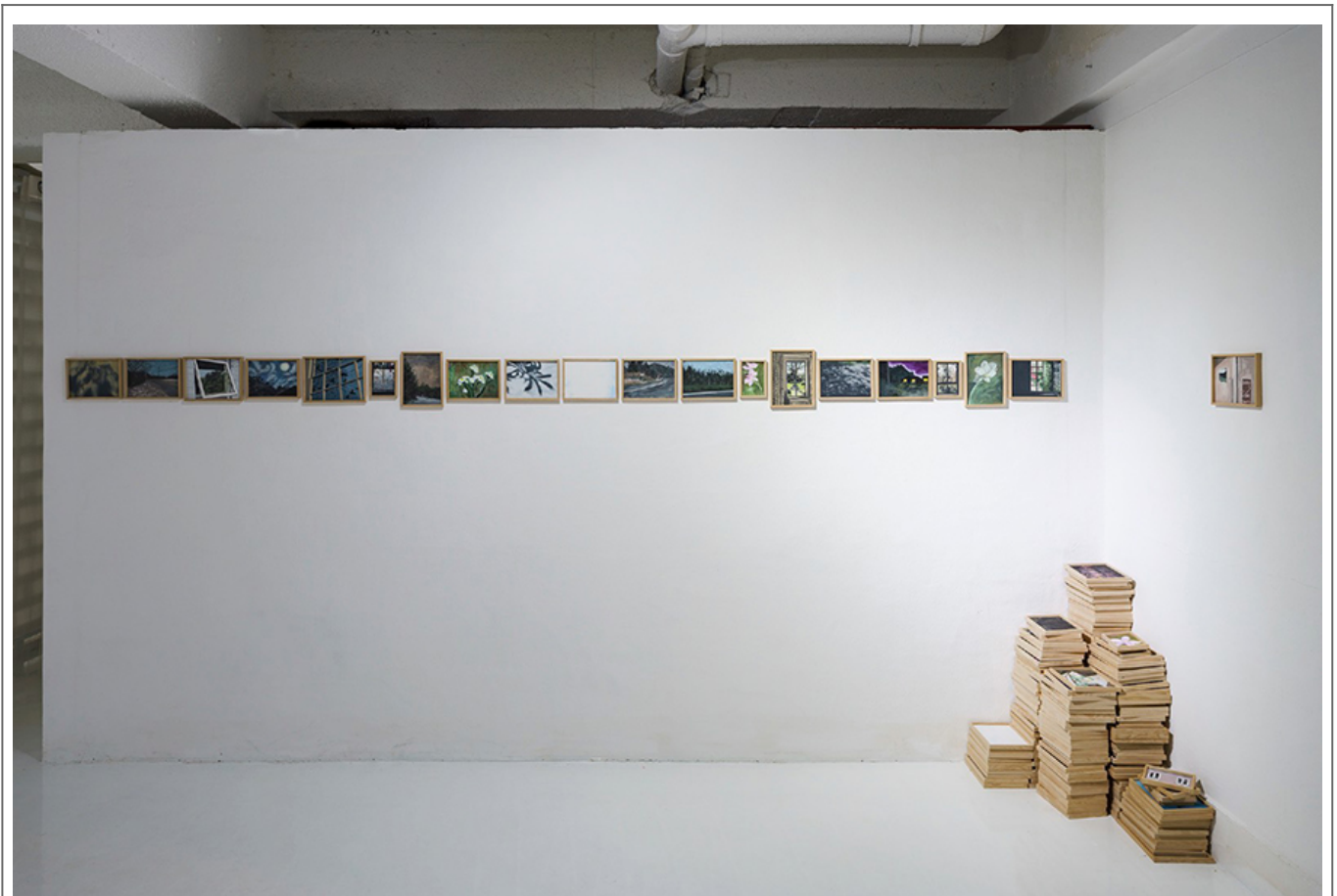
Daybreak , 박선, 1~2미터 크기의 그림, 2017

A. 이 작품은 1~2미터 크기의 작은 그림들을 한 줄로 배열하여, 마치 하나의 긴 이야기나 시간의 흐름을 보여주는 효과를 만든다. 또한, 그림들이 벽에 붙어 있지 않고, 바닥에 놓여 있는 책들의 형태로 표현되어, 관람객의 시선을 끌고, 작품의 의미를 더 깊이 이해하게 한다.