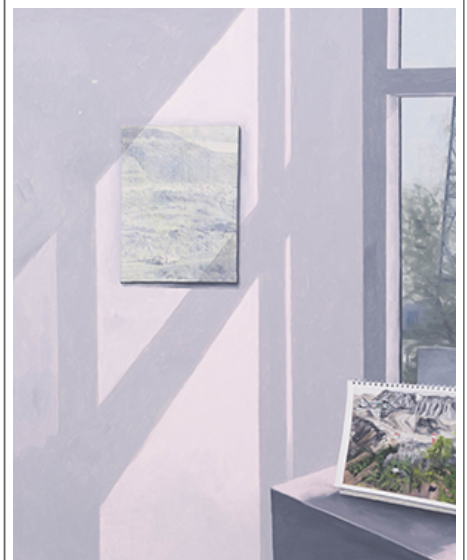
圖06, 60×90cm, 油畫 紙, 2019