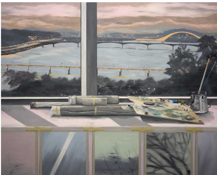
圖05, 116×91cm, 油畫 紙, 2019