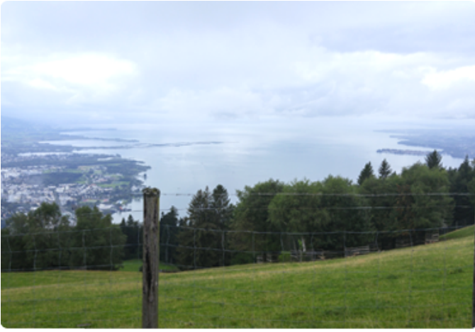
보덴호수를 끼고 있는 브레겐츠 시의 전경