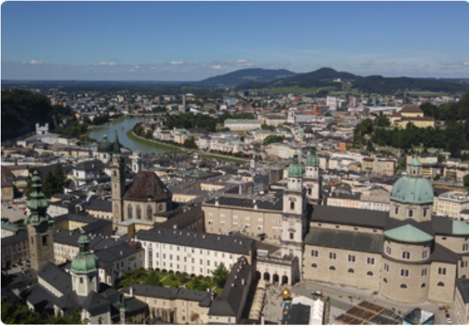
잘츠부르크 구도심 시내 전경