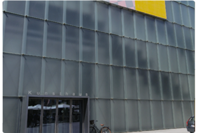
인근에 위치한 브레겐츠 콘마트 씨어터와 브레겐츠 미술관 전경

이탈리아의 예술가인 카라얀은 1948년, 베를린에서 카라얀의 오케스트라(Herbert, von Karajan)를 창립하고 1950년부터 베를린 필하모닉 오케스트라를 지휘하며, 세계적으로 이름을 알리게 되었다.