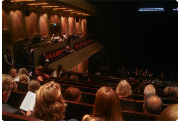
잘츠부르크 페스티벌 축제 공연장 내부