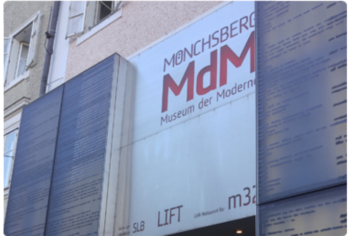
잘츠부르크 현대 미술관

이 글은 문화유산의 가치와 중요성을 강조하며, 이를 보존하고 활용하는 방법에 대해 논의합니다. 문화유산은 우리의 정체성을 형성하는 데 중요한 역할을 하며, 이를 통해 우리는 과거를 배우고 미래를 준비할 수 있습니다. 문화유산의 보호와 증진을 위한 다양한 노력과 정책이 소개되며, 이를 통해 문화유산이 지속가능하게 보존되고 활용될 수 있도록 하는 데 기여합니다.