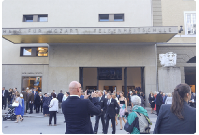
잘츠부르크 페스티벌 전경

유럽에서 20 50000 명 이상이 모입니다. 유럽에서 가장 큰 야외 축제 중 하나인 이 축제는 1946년 설립된 이래로, 매년 7월 말부터 8월 말까지 약 100000 명에서 250000 명 이상이 모입니다.