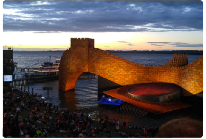
브레겐츠 페스티벌의 메인공간인 호상무대