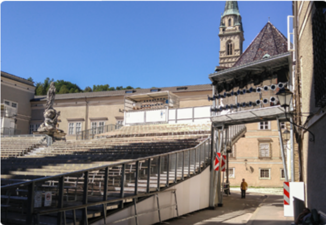
잘츠부르크 페스티벌 야외 공연장