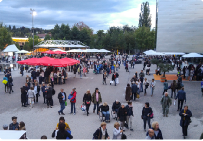
브레겐츠 페스티벌 전경