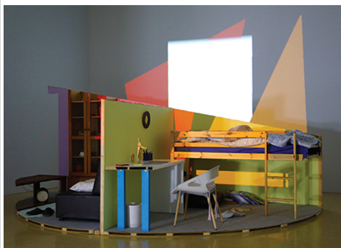
0(0), 00 00, 00000, 2017

Q. 0000 00000 00 00(00 00)0 00000, 0 0000 00000?