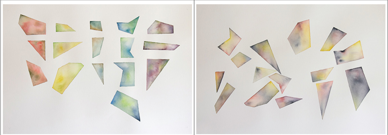
00, 000 00, 50x70cm(5pcs), 2019

A. 000 00 000 000 00 00 00 000 000 000 00000 0000. 00 000 0000 00 0 0000 000 000 000 0000 000. 000 00, 00 000 000 00 0000 000 00 00, 00 00 00 000 00000 0 0 00 00000 0000 00 0 00 000, 00 00 0 000 00000 000 00000 000 000 00 000 00. 000 0000 00 000 000 0 00 000 00. 00 000 000 000 00 0000 000 00000, 000 000 00 0000. 00 0000 00 <000000hyun00happyj33000000000000000000...> 00, 0000 00 0 0000 000 00 000, 000 000 0000 00 000 000 00000 000 0 00. 00 0000 0 0000 00 0 0, 0 00 000 00 000 00000 0000. 0 000 '000 000 0 0000 0000 00 000 000' 00 0000 000 00000, 0000 000 00 00, 00 00 00 00. 00 0000 000 00 0000 000000 000000 0 0 00.