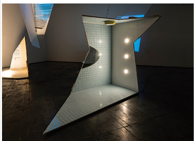
hyun happyj33..., 2019