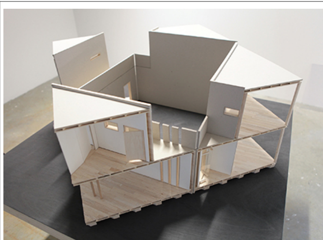
0000, 00000, 0000, 0000, 0000000, 00, 00, 120×120×50cm, 2012