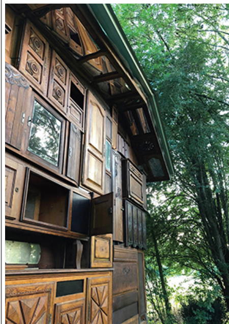
이 작품, 나무, 400x500x390cm, 2013

이 작품은 2019년 <공간지각> 전시를 위해 제작된 작품이다. 이 작품은 나무를 사용하여 제작된 것으로, '공간지각' 전시를 위해 제작된 작품이다. 이 작품은 나무를 사용하여 제작된 것으로, '공간지각' 전시를 위해 제작된 작품이다.