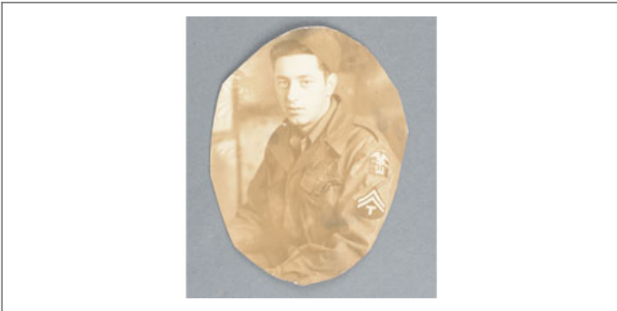
〇〇〇 1〇〇〇〇 〇〇 〇〇〇 〇〇〇 〇〇(〇〇〇〇〇〇〇 〇〇)

〇〇〇 〇 〇 〇 〇 〇〇〇 〇〇 〇〇〇〇 〇2〇 〇〇 〇〇〇 〇〇〇 〇〇〇〇 〇〇〇〇〇 〇〇〇 〇〇〇 〇〇〇〇 〇〇. 〇〇〇 〇〇〇 〇〇 〇〇 〇〇〇〇 〇〇〇〇 〇〇 〇〇〇 〇〇〇〇 〇〇〇 〇〇〇 〇〇〇〇〇 〇〇.