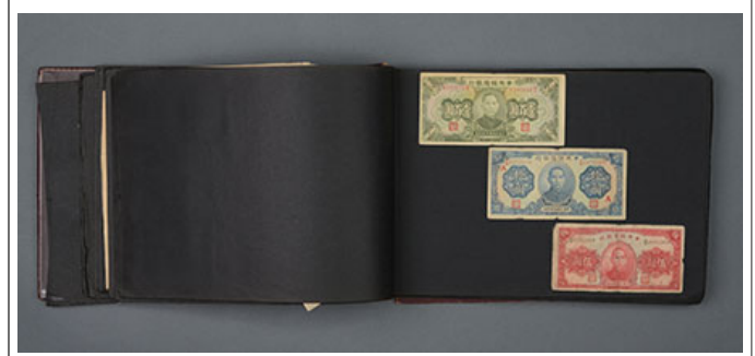
戰時 40000 圓 軍用 貨幣 交換 票(戰時軍用貨幣)