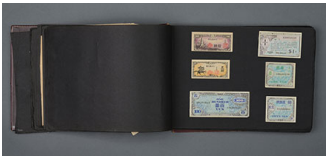
戰時 軍用 物品 3 項 之 展示 區 (軍用 物品 之 展示 區)