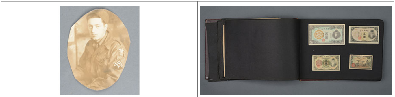
戰時 10000 圓 軍用 貨幣 交換 票(戰時軍用貨幣)

戰時軍用貨幣交換票的發行，是為了方便軍人購買軍用物資，並防止軍用物資被敵方竊取。戰時軍用貨幣交換票的發行，也是為了防止軍用物資被敵方竊取。戰時軍用貨幣交換票的發行，也是為了防止軍用物資被敵方竊取。