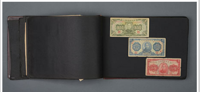
戰時 軍用 物品 4 項 之 展示 區 (軍用 物品 之 展示 區)