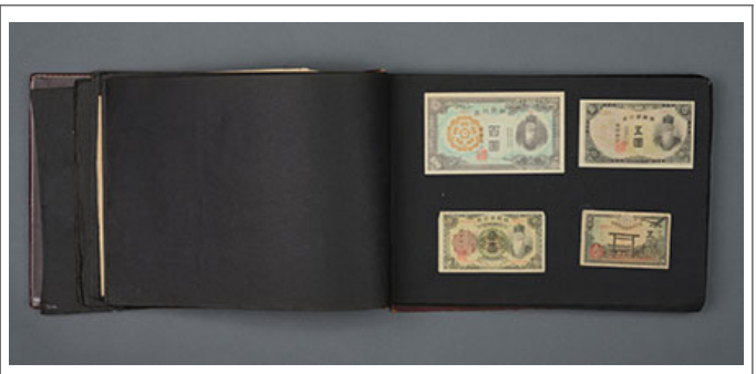
戰時 軍用 物品 2 項 之 展示 區 (軍用 物品 之 展示 區)