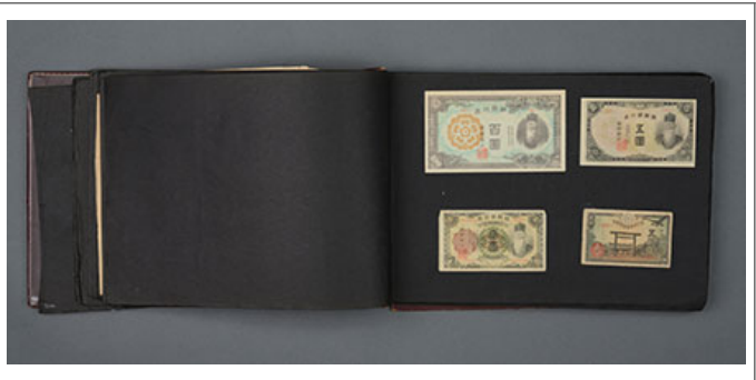
〇〇〇 2〇〇〇〇 〇〇 〇〇 〇 〇〇〇 〇〇〇 〇 〇〇 〇(〇〇〇〇〇〇〇 〇〇)