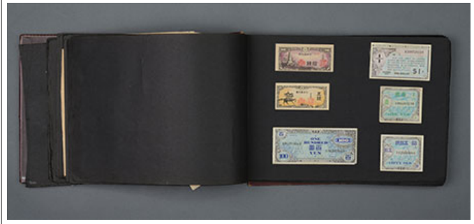
〇〇〇 3〇〇〇〇 〇〇 〇〇 〇 〇〇〇 〇〇〇 〇 〇〇 〇(〇〇〇〇〇〇〇 〇〇)