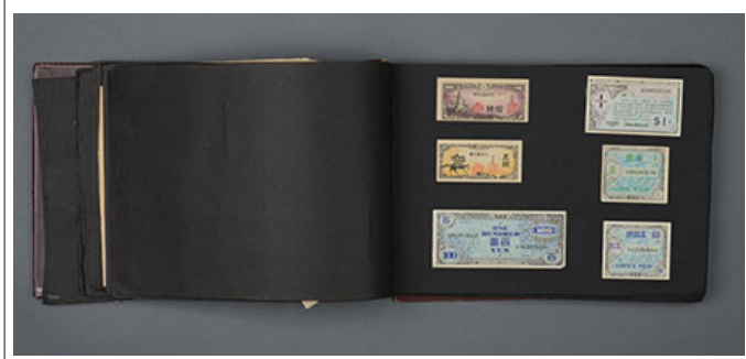
戰時 30000 圓 軍用 貨幣 交換 票(戰時軍用貨幣)