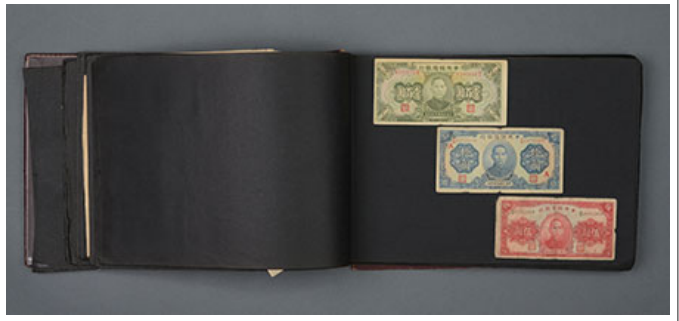
〇〇〇 4〇〇〇〇 〇〇 〇〇 〇 〇〇〇 〇〇〇 〇 〇〇 〇(〇〇〇〇〇〇〇 〇〇)