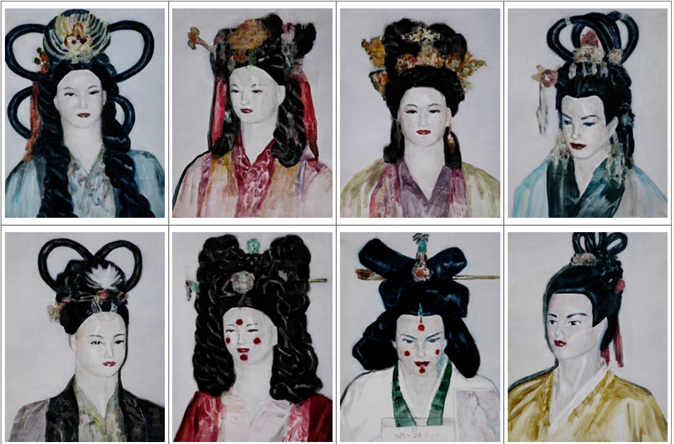
○○○, 53x40cm(8pcs), ○○○ ○○, 2013

A. ○○ ○○○○○ 2017○○ ○○○ <○○> ○○ ○○○ ○○ ○ ○○○. ○ ○○○ 2013○○ ○○○ ○○ <○○○>(2013)○ ○○○○ ○○○○○. ○○ ○ ○○○○○ ○○ ○○ ○○ ○○○ '○○'○○ '○○ ○○' ○○○ ○○○○○○ ○○○ ○○ ○○○○ ○○○○ ○○ ○○○. ○○○○ ○○○○○○ '○○'○○ ○○○ ○○○ ○○○ ○○○○ ○○○○ ○○○ ○○○. ○○○ '○○○○○○ ○○ ○○○ ○○ ○○ ○○○○ ○○'○ ○ ○○○ ○○○○ ○○○ ○○○○. ○ ○ ○○○ <○○> ○○○ ○○○ ○○○○ ○○○○○ ○○, ○○ ○○○○ ○ ○○○ ○○○ ○○○○. ○○ ○○ ○○ ○○ ○○○○ ○○ ○○○ ○ ○○ ○○ ○ ○○○○ ○○○ ○○○ ○○ ○○○ ○○○ ○○ ○○○ ○○○ ○○○ ○○○ ○○○ ○○○ ○○○ ○○○ ○○○ ○○○ ○○○ ○○○ ○○○○○ ○○, ○○○ ○○○○ ○○○ ○○○○ ○○○. ○○ ○○○○○ ○○○ ○○○ ○○○ ○○○ ○○○ ○○ ○○○○ ○○○○ ○○○○ ○○○○ ○○○ ○○○. ○○○ ○○ ○○ ○○○○ ○○○ ○○○ ○○○○ ○○ ○ ○○○ ○○○○○ ○○.