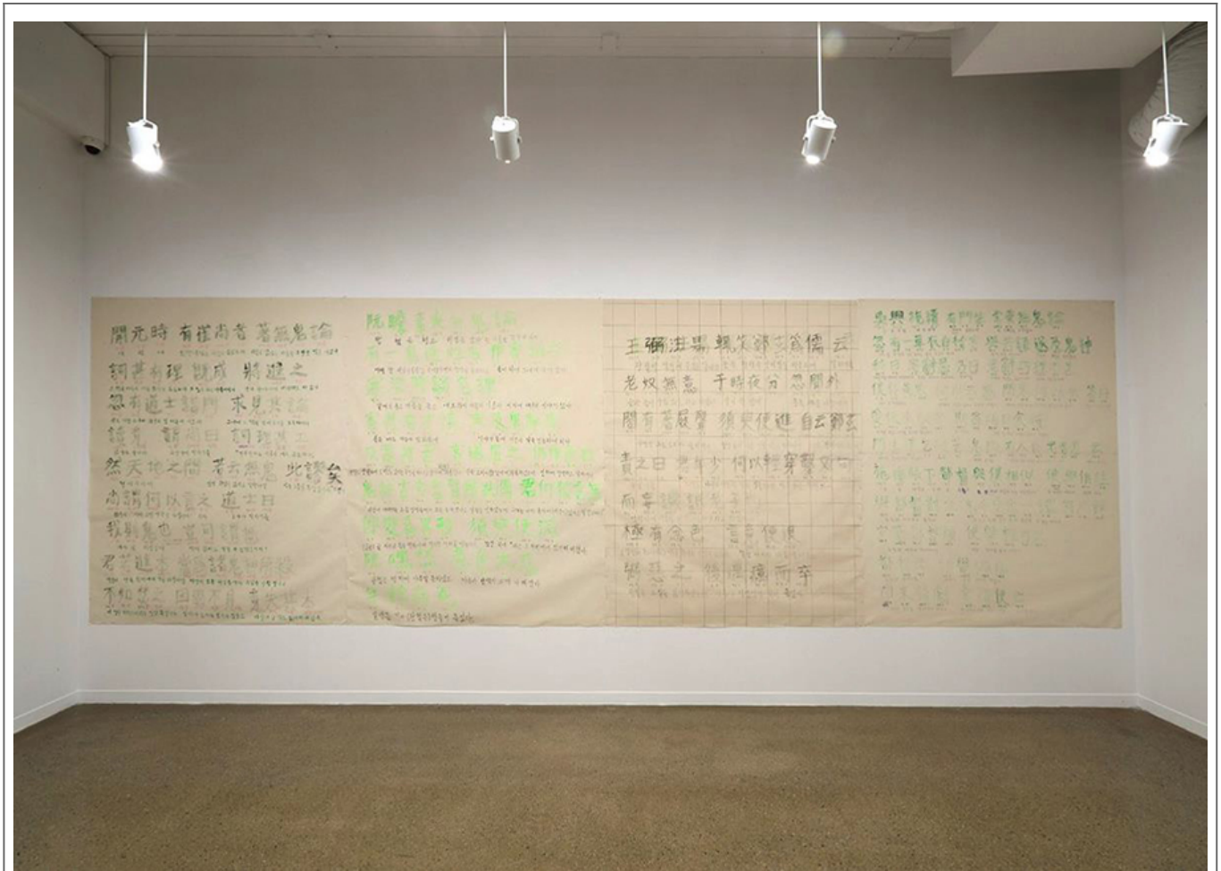
〇〇〇〇 〇〇 〇〇〇 220×180, 〇〇〇 〇〇, 〇〇〇〇, 2019