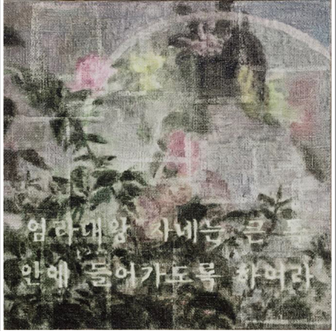
□□□□ □□, 45x45cm, □□ □□, 2018