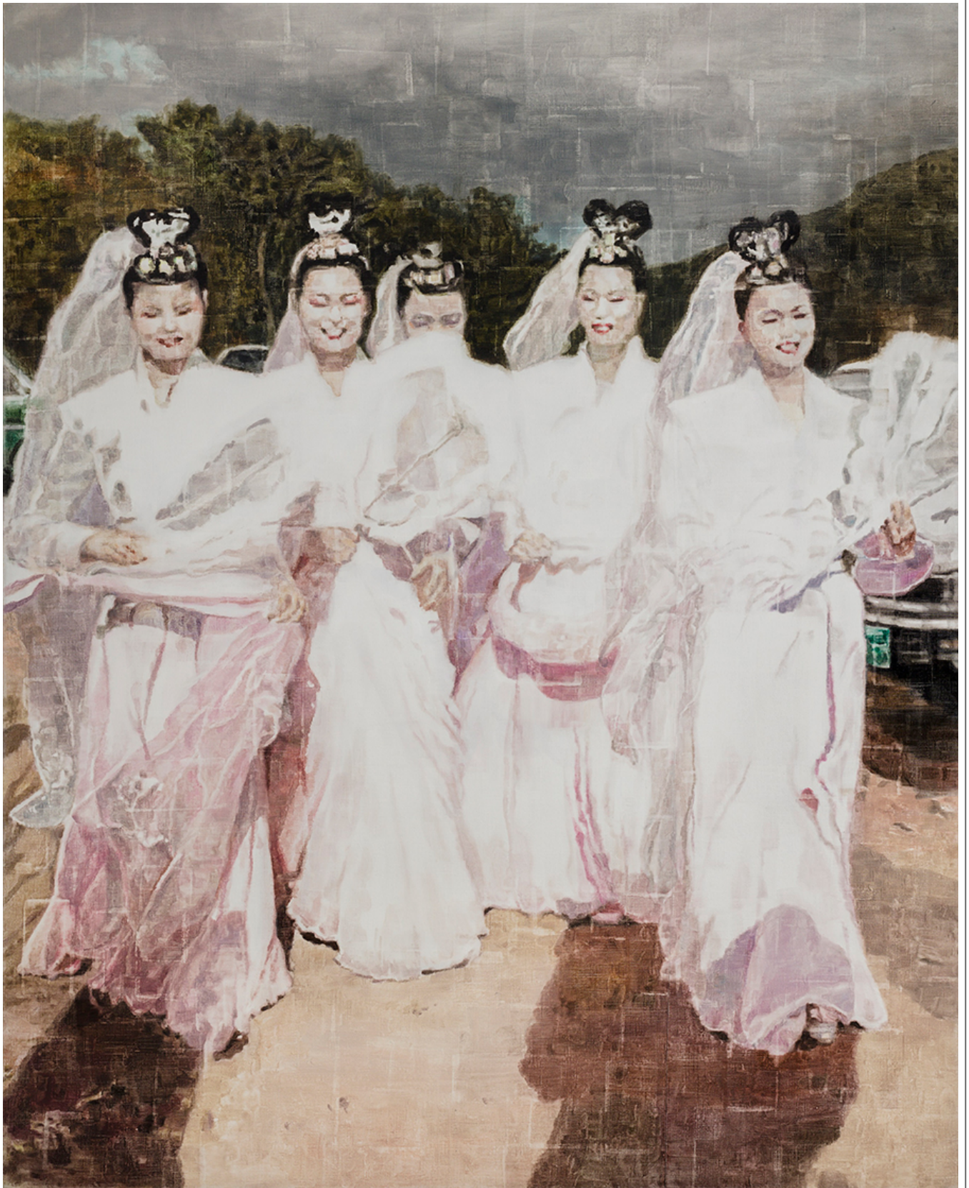
서민, 220x180cm, 유채화, 2017