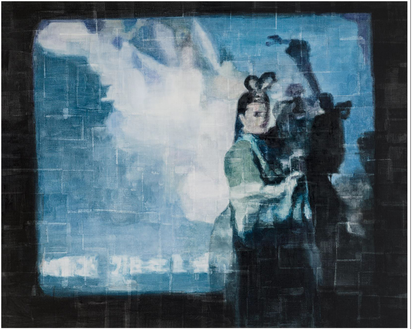
Orhan Pamuk, Blue Room, 130x163cm, 2017

Q. Orhan Pamuk, Blue Room, 130x163cm, 2017