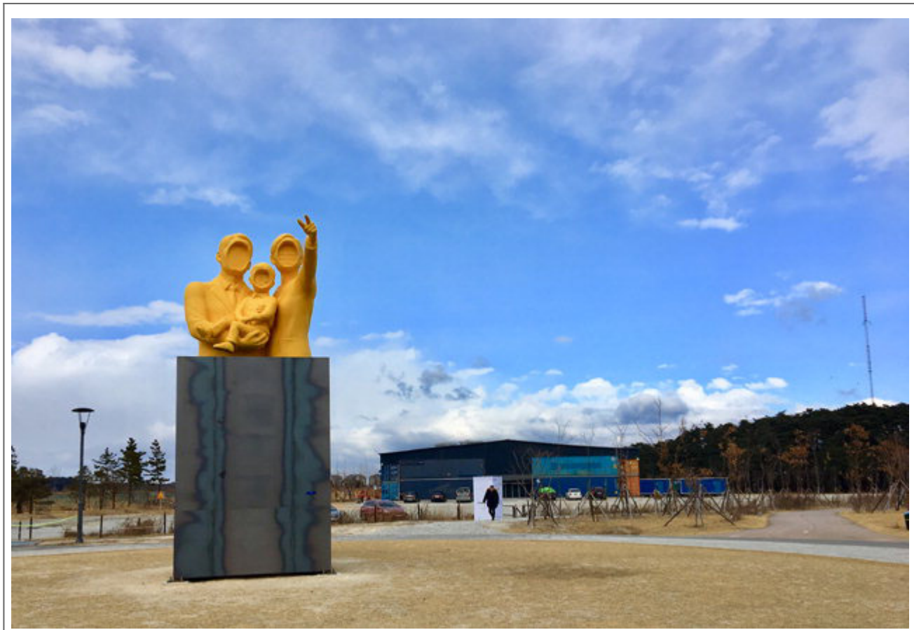
서울미술재단 2018년 공모전, 2018

CH0(2016, 서울미술재단) 등에 출품했으며, 서울미술재단의 'two way art' 2차 공모전에 출품했다. 2018년 서울미술재단 서울미술재단에 출품했다.