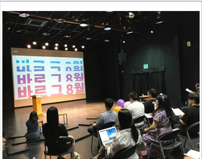
2018 10월 20일 오프닝, 2018