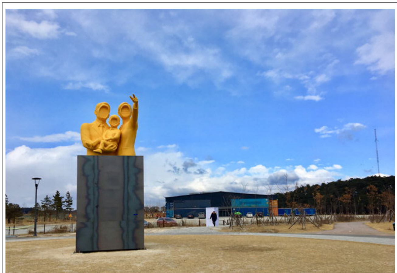
한양대학교 미술관 2018년 전시, 2018

작가는 2000년 서울대학교 미술대학을 졸업하고 2001년 <한양대학교>에서 석사학위를 취득했다. 2002년부터 2007년까지 서울대학교 미술대학에서 강의했다. 주요 개인전 : 2005 X (한양대학교 미술관, 2019), 2007 (한양대학교 미술관, 2018), 2008 (한양대학교 미술관, 2018), 2009 (한양대학교 미술관, 2018) 등이 있다. 2003년 서울대학교 미술대학에서 'two way art' 2003 전시를 열었다. 2018년 서울대학교 미술대학에서 'two way art' 2018 전시를 열었다.