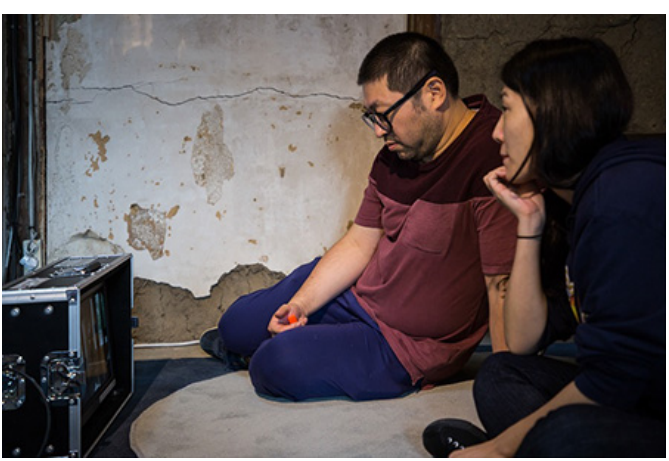
OX-00 : 000 X 0000, 00 000, 000 0000, 2018