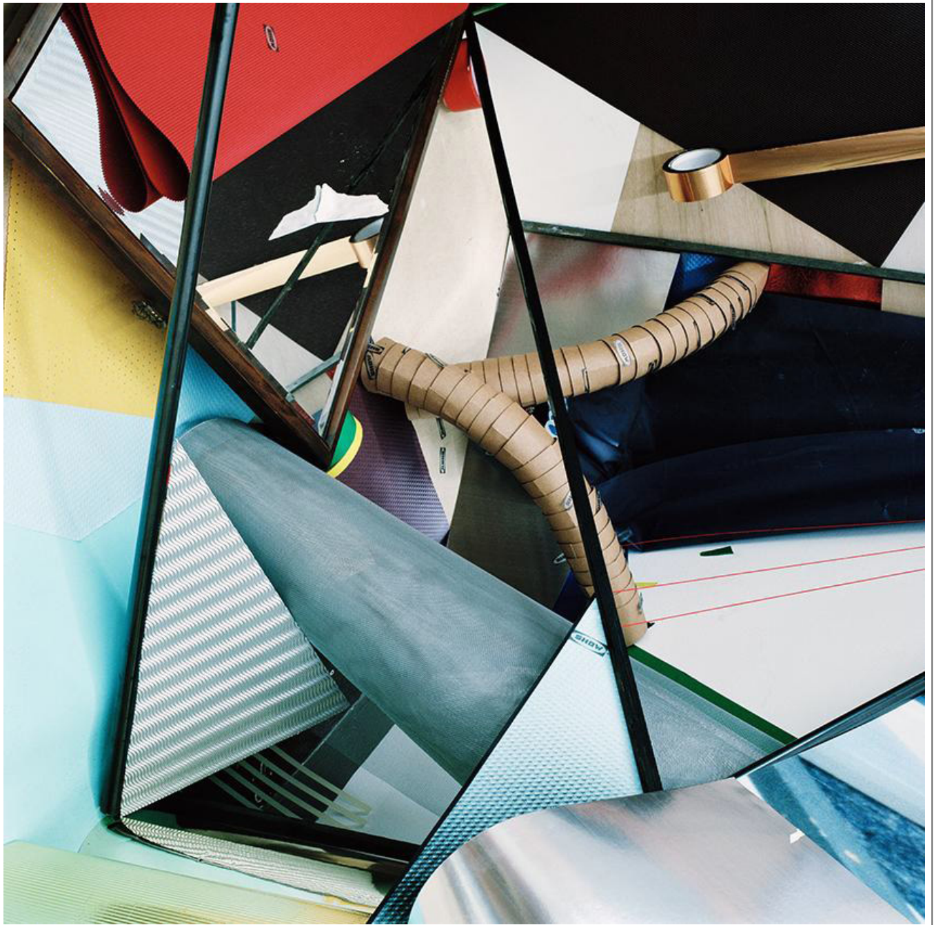
SHOW , 120x120cm, 混合 媒材, 2018