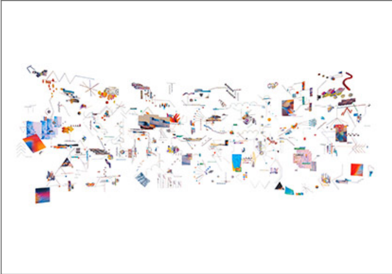
數 據 視 覺 化 (Mojave Day and Night)_圖 案_42x100cm_2019

A. 此 項 目 係 以 數 據 為 基 礎 之 視 覺 化 展 示， 其 中 包 含 了 大 量 之 數 據 點， 並 以 線 性 之 方 式 將 其 連 接 起 來， 形 成 一 個 網 絡 結 構。 此 種 視 覺 化 展 示 之 目 的， 在 於 讓 觀 眾 更 容 易 地 理 解 大 量 數 據 之 關 係 與 變 化。 此 項 目 係 以 數 據 為 基 礎 之 視 覺 化 展 示， 其 中 包 含 了 大 量 之 數 據 點， 並 以 線 性 之 方 式 將 其 連 接 起 來， 形 成 一 個 網 絡 結 構。 此 種 視 覺 化 展 示 之 目 的， 在 於 讓 觀 眾 更 容 易 地 理 解 大 量 數 據 之 關 係 與 變 化。 此 項 目 係 以 數 據 為 基 礎 之 視 覺 化 展 示， 其 中 包 含 了 大 量 之 數 據 點， 並 以 線 性 之 方 式 將 其 連 接 起 來， 形 成 一 個 網 絡 結 構。 此 種 視 覺 化 展 示 之 目 的， 在 於 讓 觀 眾 更 容 易 地 理 解 大 量 數 據 之 關 係 與 變 化。