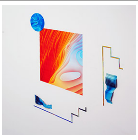
數 據 視 覺 化 (Mojave Day and Night)_圖 案_42x100cm_2019_圖 案

Q. 此 項 目 係 以 數 據 為 基 礎 之 視 覺 化 展 示， 其 中 包 含 了 大 量 之 數 據 點， 並 以 線 性 之 方 式 將 其 連 接 起 來， 形 成 一 個 網 絡 結 構， 對 嗎？