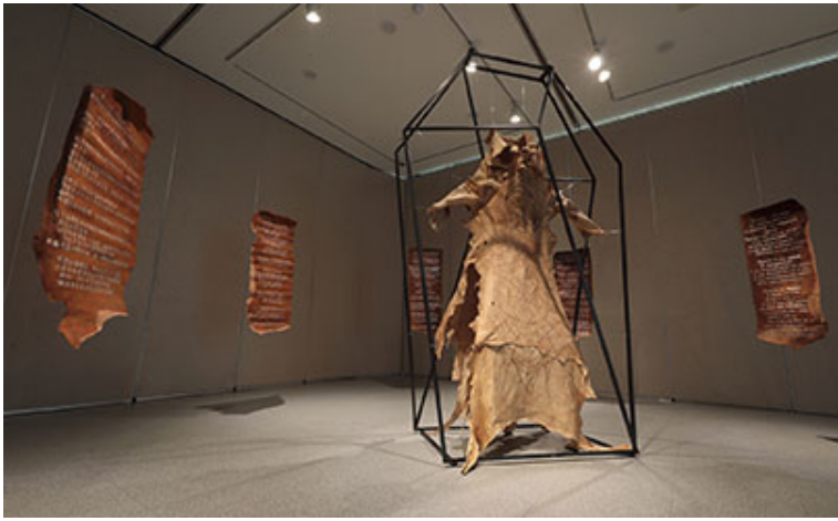
작품(Immolation)_5000 100000 1000