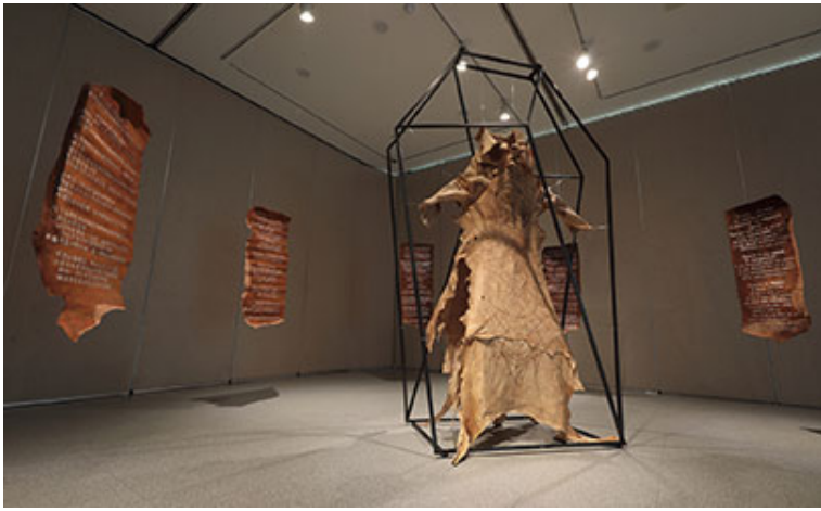
□□(Immolation)_500 □□□□ □□ (□□□□□□, □□, □□, □□□□), 120□ □□ □ □□ □□ □□□□, □ □□□_400×150×280cm_2017