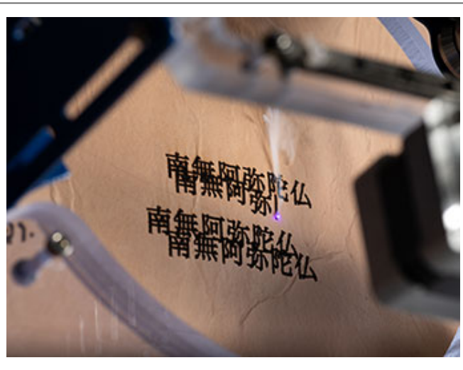
작품 'The Scorched World'_작가, 2008, 2009, 2010, 2011, 2012, 2013, 2014, 2015, 2016, 2017, 2018, 2019

Q. 이 작품은 'The Scorched World'라는 제목을 가진 작품으로, 관객들이 작품에 대해 질문을 했습니다?