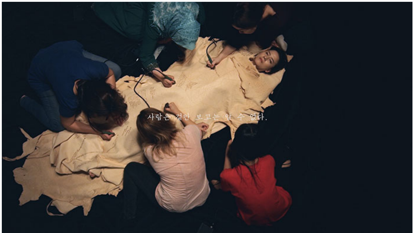
기억의 공간(Anamnesis)_04 4K_2017 25_2017

이것이 기억의 공간이다. 기억은 공간 속에서 이루어진다. 기억의 공간은, 기억의 시간과 기억의 장소, 기억의 사람, 기억의 사물, 기억의 감정, 기억의 생각, 기억의 행동, 기억의 문화, 기억의 정치, 기억의 경제, 기억의 사회, 기억의 공동체, 기억의 세계, 기억의 우주, 기억의 다중성을 지닌다. 기억의 공간은, 기억의 시간과 기억의 장소, 기억의 사람, 기억의 사물, 기억의 감정, 기억의 생각, 기억의 행동, 기억의 문화, 기억의 정치, 기억의 경제, 기억의 사회, 기억의 공동체, 기억의 세계, 기억의 우주, 기억의 다중성을 지닌다.