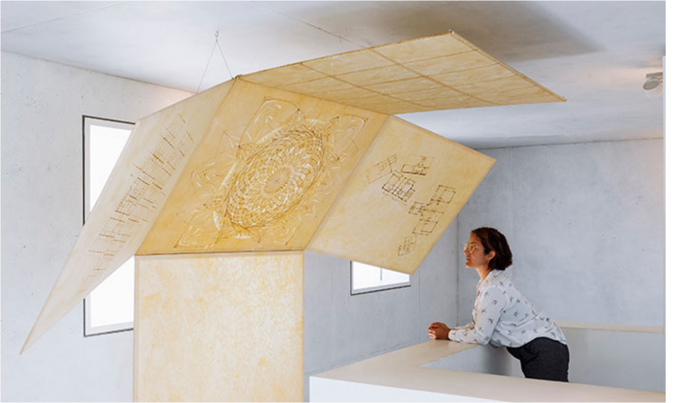
□□□□ □□□□ □□(A Concrete Box for Human Storage)_2-3□ □□□ □□, □□ □ □□_480×330cm_2018