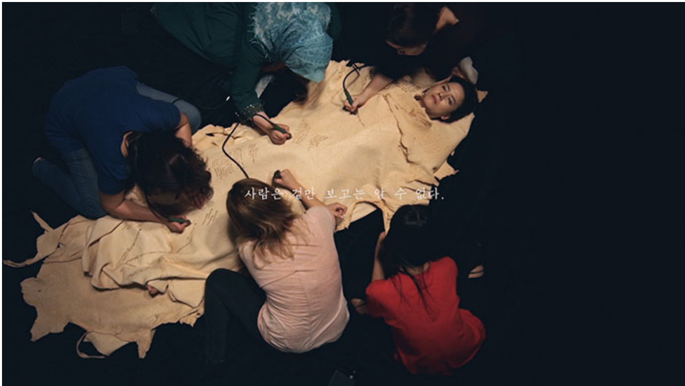
안아메시스(Anamnesis) _ 4K_20 25 _ 2017

이 수업을 통해 아이들은 자신의 생각을 자유롭게 표현할 수 있다. 이 수업은 3~4명의 아이들로 구성된 팀을 형성하여 진행한다. 팀 내에서 아이디어를 내는 역할, 발표하는 역할, 그리고 팀을 운영하는 역할을 맡는다. 이 수업은 팀워크와 창의력을 기르는 데 도움이 된다. 이 수업은 팀워크와 창의력을 기르는 데 도움이 된다. 이 수업은 팀워크와 창의력을 기르는 데 도움이 된다. 이 수업은 팀워크와 창의력을 기르는 데 도움이 된다.