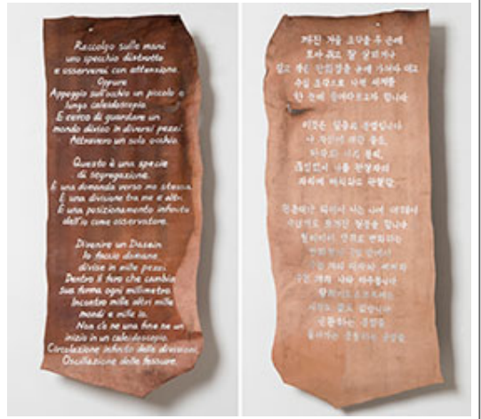
□□(Immolation)_□□□□□□ □□ □□ □□ □□ _□□□□□ □ □_48×113cm_2017