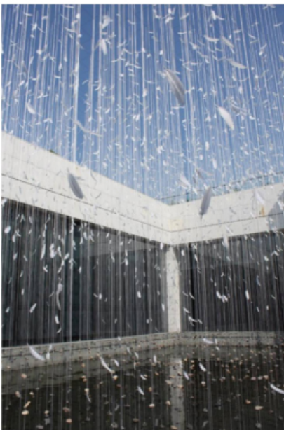
Nanun Dol 2013 Hangzhou - The Space 58 1337 stones from Hangzhou, Silk threads, feathers, variable installation in Zhejiang Art Museum Hangzhou, 2013