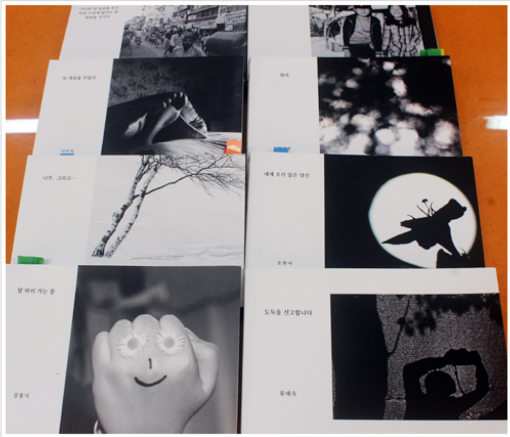
글게미 회원들이 만든 손바닥 사진책

○○○○ ○○○○ ○○○○ ○○○ ○○ ○○, ○○ ○○○○ ○○○ ○○ ○○○○ ○○○○ ○○○○ ○○○○○ ○○.