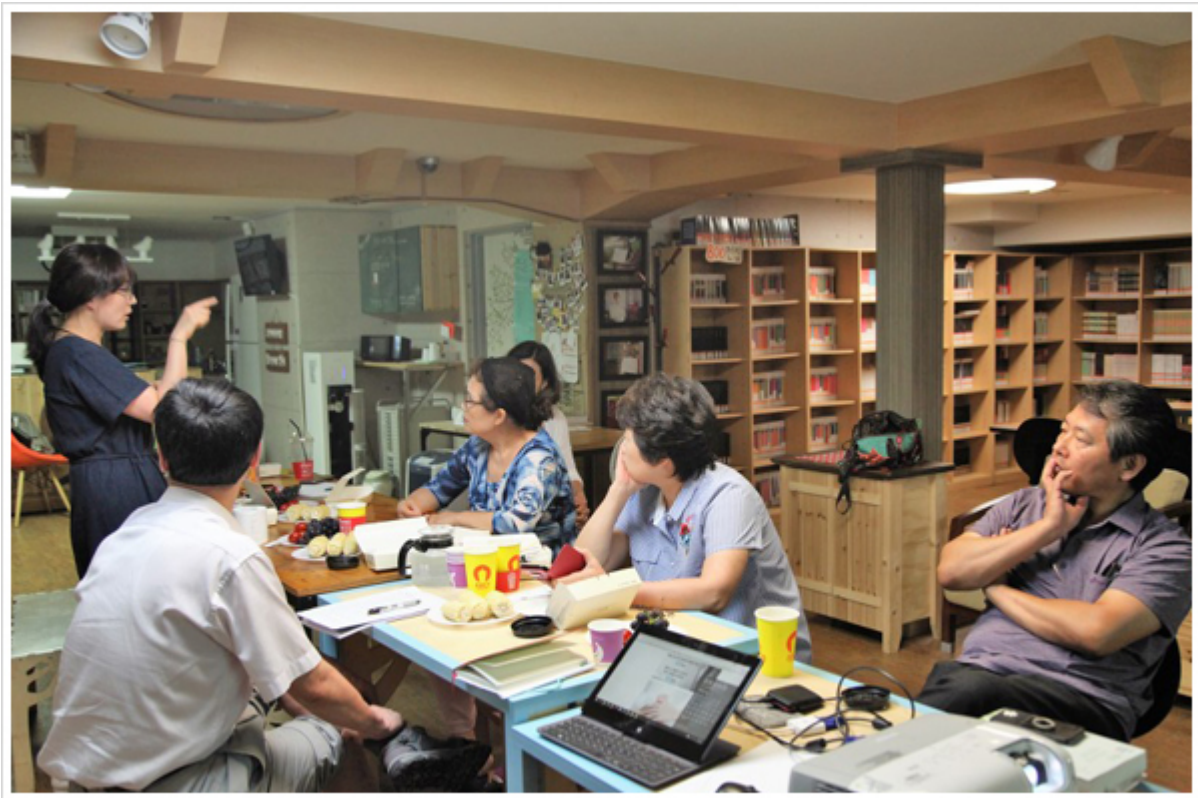
카드소셜 작업을 하고 있는 글게미 회원들

모든 것이 모든 것은 모든 것. 10 모든 것은 모든 것, 200 모든 것은 모든 것 모든 것 모든 것 모든 것 모든 것. 모든 것은 모든 것 '모든 것' 모든 것은 모든 것 모든 것 모든 것 모든 것 모든 것. 모든 것은 모든 것 모든 것 모든 것 모든 것. 모든 것은 <모든, 모든> 모든 것 <모든 것 모든 것 모든 것>모든. 모든 것은 모든 것 모든 것은 모든 것 모든 것 모든 것 모든 것 모든 것. 모든 것은, 모든, 모든, 모든 것 모든 것은 모든 것 모든 것, 모든 것은 모든 것 모든 것 모든 것 모든 것.