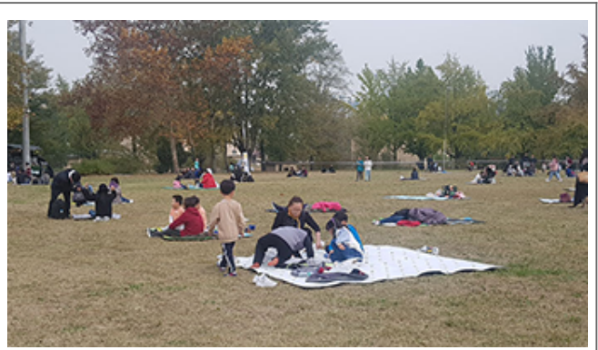
<가을의 향연> 가을 축제 모습 2023. 10. 31.

이번 가을 축제는 '가을의 향연'을 주제로 다양한 공연과 전시가 준비되어 있었다. 특히, 전통 민속놀이와 현대 예술의 결합이 돋보이는 프로그램이 많은데, 이를 통해 학생들과 교직원들이 가을의 정취를 느끼고 소통할 수 있는 기회를 가졌다. 또한, 이번 축제에는 '가을의 향연'을 주제로 다양한 공연과 전시가 준비되어 있었다. 특히, 전통 민속놀이와 현대 예술의 결합이 돋보이는 프로그램이 많은데, 이를 통해 학생들과 교직원들이 가을의 정취를 느끼고 소통할 수 있는 기회를 가졌다.