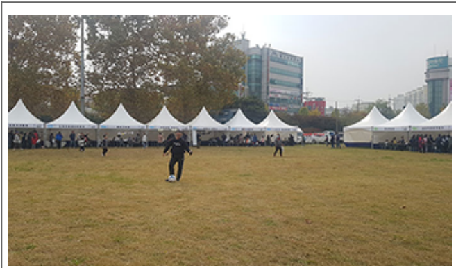
<가을의 향연> 가을 축제 모습 2023. 10. 31.

2023년 10월 31일(수) 오후 2시부터 4시까지 서울대학교 운동장에서 '2023년 가을 축제'가 열렸다. 이번 축제는 '가을의 향연'을 주제로 다양한 공연과 전시가 준비되어 있었다. 특히, 전통 민속놀이와 현대 예술의 결합이 돋보이는 프로그램이 많은데, 이를 통해 학생들과 교직원들이 가을의 정취를 느끼고 소통할 수 있는 기회를 가졌다. 또한, 이번 축제에는 '가을의 향연'을 주제로 다양한 공연과 전시가 준비되어 있었다. 특히, 전통 민속놀이와 현대 예술의 결합이 돋보이는 프로그램이 많은데, 이를 통해 학생들과 교직원들이 가을의 정취를 느끼고 소통할 수 있는 기회를 가졌다.