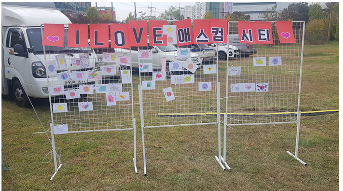
○○○○○ ○○○○ ○○○ ○○ ○○ ○○○ ○○○○ ○○○. ○○○○