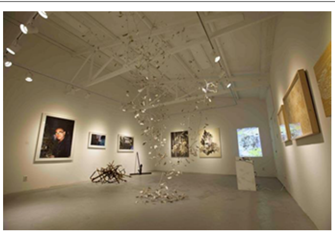
공간은 다양한 형태로 존재한다_2015