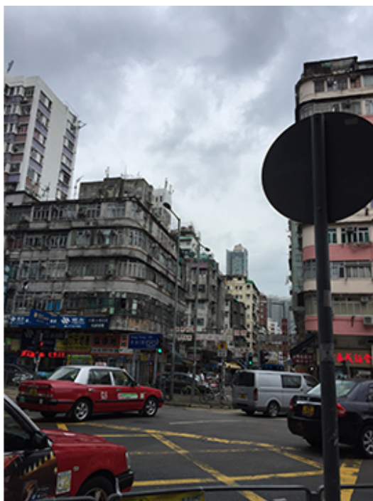
ADO Urban Research-Asian Port City Series_Hong Kong_2016