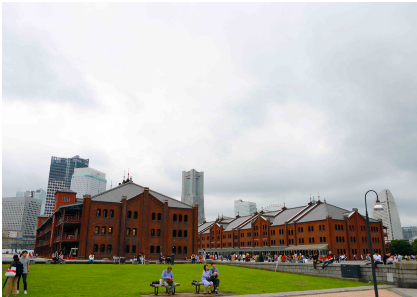
图 4 青森县立美术馆

青森县立美术馆于1910年作为青森县立博物馆开馆，是青森县最早的公共建筑。青森县立美术馆于1989年作为青森县立美术馆开馆，是青森县最新的公共建筑。青森县立美术馆于1992年作为青森县立美术馆开馆，是青森县最新的公共建筑。