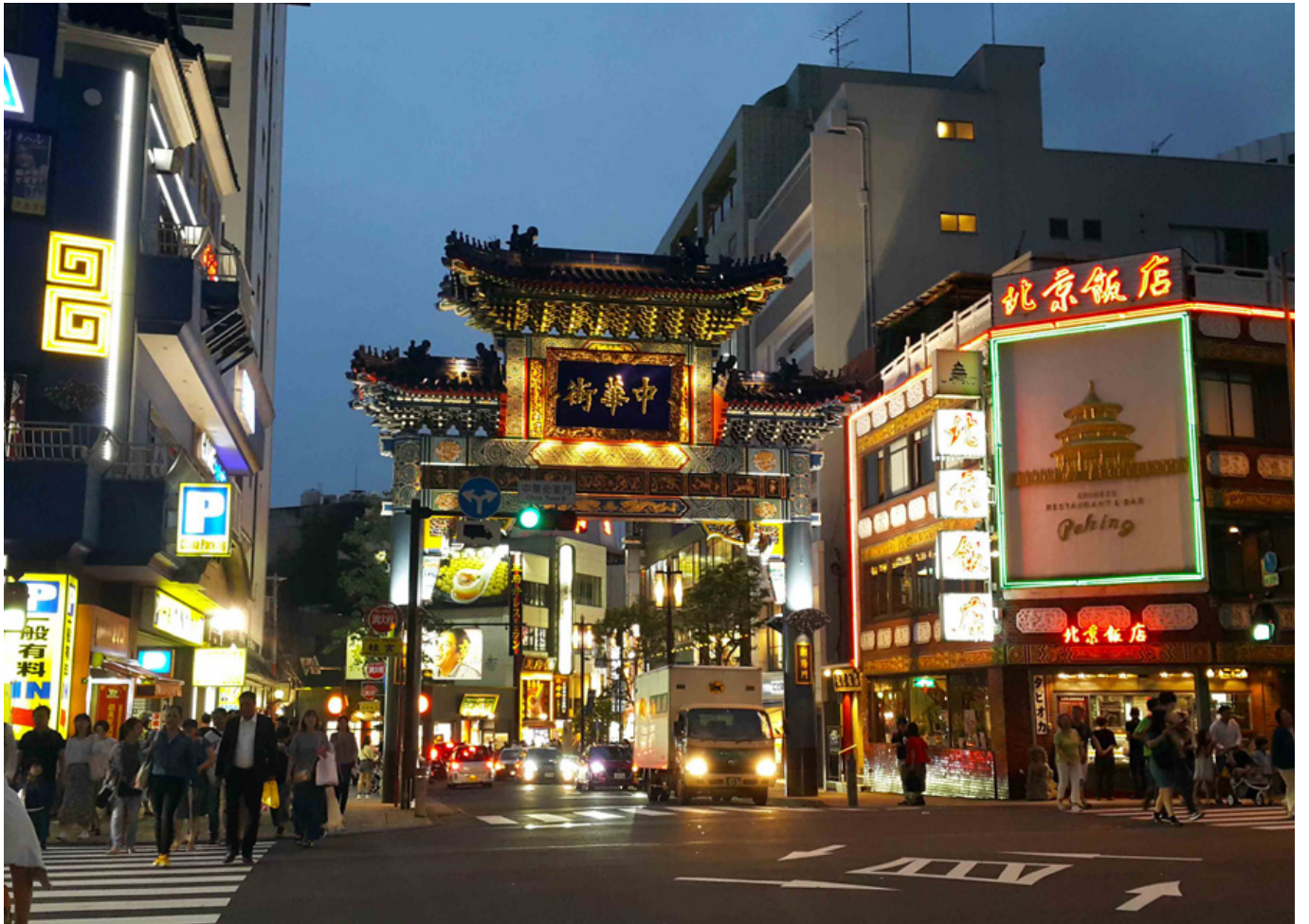
圖 7 中華街

中華街是台北最熱鬧的街道之一，也是許多遊客必去的景點。這裡有傳統的建築、美食和購物中心，是體驗台北夜生活的最佳地點。