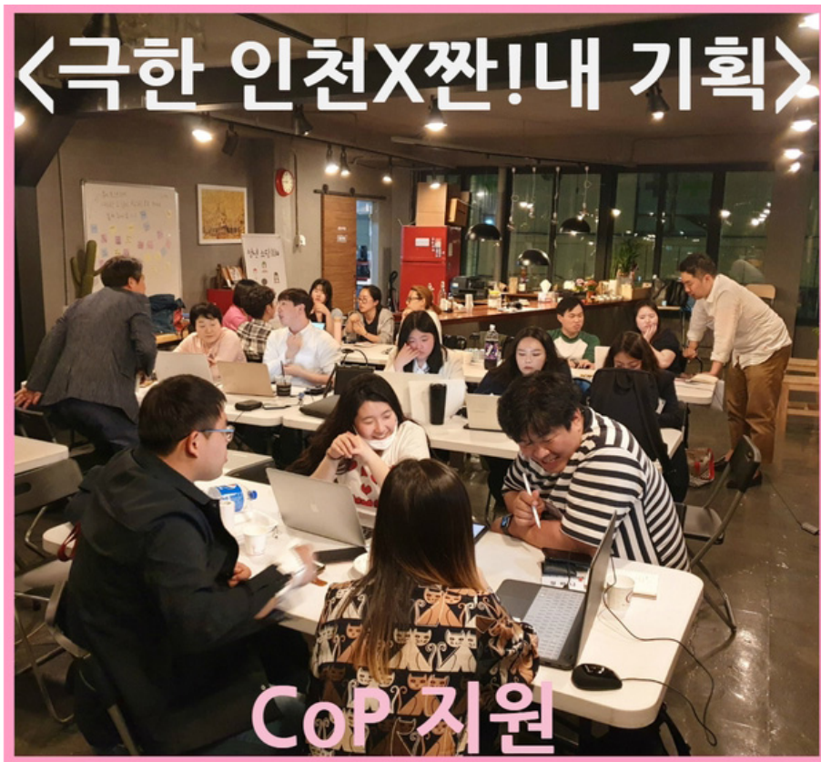
1 (인: 인천X짠! 내 기획)

2019년 2월 20일 <인천X짠! 내 기획> CoP(Community of Practice) 지원