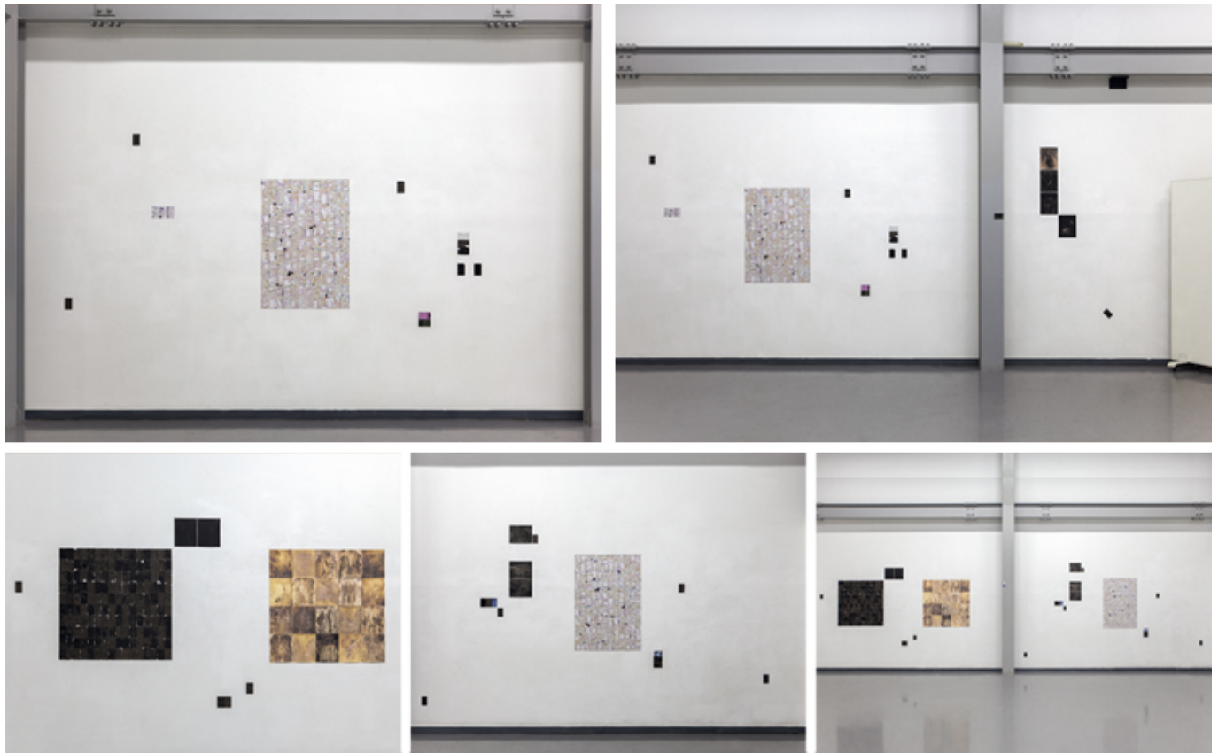
끈적한 자유낙하 (전시전경) - Polaroids, Size Variable, 2016 끈적한 자유낙하 (전시전경) - Fiber Based Silver Gelatin Prints and Polaroids, Size Variable, 2016

이러한 작품은 '이미지'와 '지지체'의 관계를 탐구하는 데 초점을 맞춘다. 작품은 다양한 크기의 이미지와 지지체를 사용하여, 관객의 시선을 끌고, 작품의 의미를 탐구하게 한다. 이 작품은 '이미지'와 '지지체'의 관계를 탐구하는 데 초점을 맞춘다. 작품은 다양한 크기의 이미지와 지지체를 사용하여, 관객의 시선을 끌고, 작품의 의미를 탐구하게 한다.