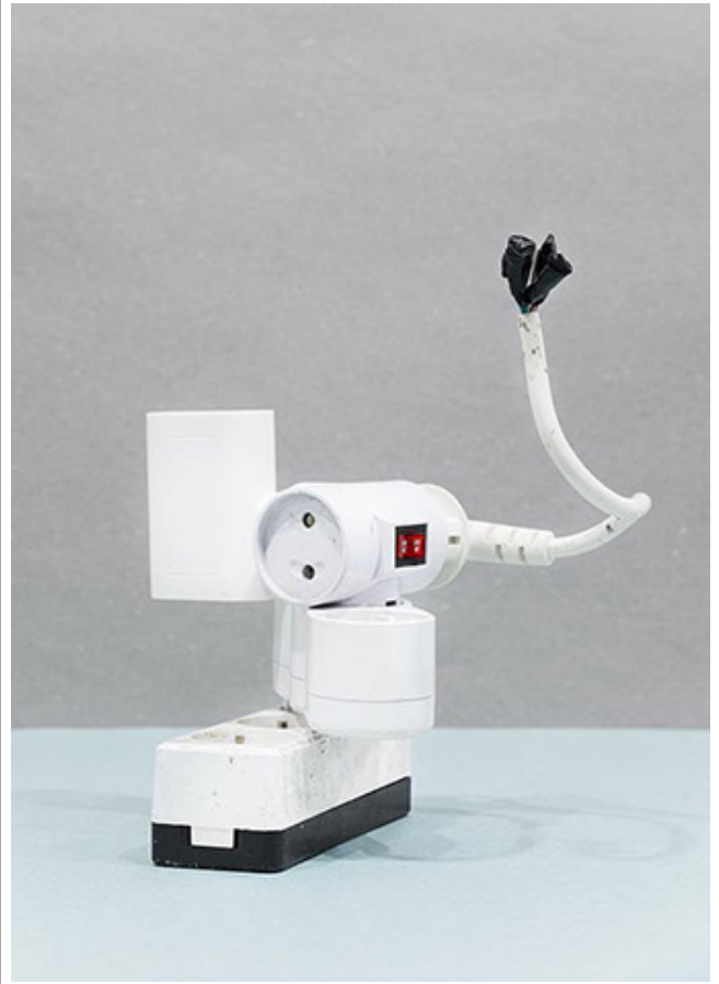
art Things_electric outlet_Archival pigment Inkjet Print_50x70cm_2018

000 00 00 0000 0000 00 0000 00 000000, 00 00 000 00000 0000 00 00 000000 000000 000. 0 000 0000 0000000 000 0 0000 000 0 000, 000 00 0000 00 00 000 0000 00 0000 0000 000 00000. 00 000 000 0 0 0000 000000 000 000 00000 0 0 000.