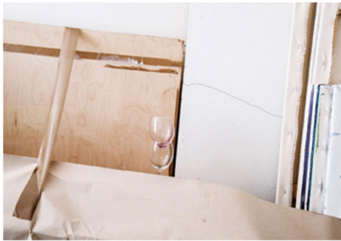
Nr12cz_Archinal Inkjet Print_50x70cm_2016