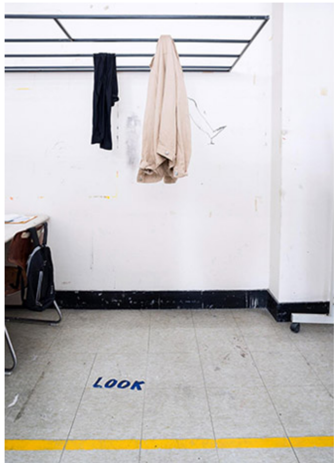
Nr12cz_Archinal Inkjet Print_43x34cm_2015

A. 這件作品通過對空間的重新定義，展現了空間的層次和時間的流逝。它利用衣櫃的結構，創造了一個靜態的場景。這件衣物（一件米色的外套）在衣櫃中懸掛，彷彿在等待某人。這種靜態的場景與時間的流動形成了強烈的對比。這件作品‘靜’與‘動’的關係，通過衣櫃的結構和衣物的懸掛，展現了空間的層次和時間的流逝。這件作品不僅是一個靜態的場景，更是一個充滿時間感的空間。這件作品通過對空間的重新定義，展現了空間的層次和時間的流逝。它利用衣櫃的結構，創造了一個靜態的場景。這件衣物（一件米色的外套）在衣櫃中懸掛，彷彿在等待某人。這種靜態的場景與時間的流動形成了強烈的對比。這件作品‘靜’與‘動’的關係，通過衣櫃的結構和衣物的懸掛，展現了空間的層次和時間的流逝。這件作品不僅是一個靜態的場景，更是一個充滿時間感的空間。