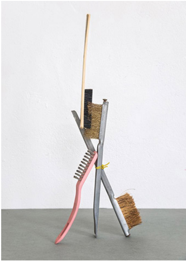
art Things_Iron brushes_Archival pigment Inkjet Print_50x70cm_2018