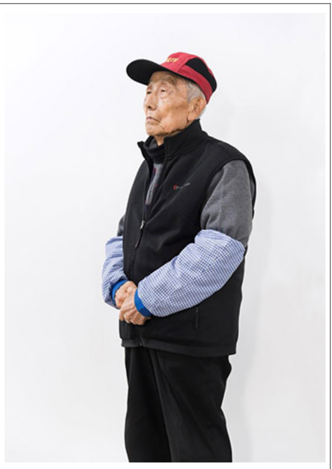
000 000_100000000_Archival pigment Inkjet Print_10x13cm_2017

Q. 000 0000 00 00(00 00)0 0000 0 000 0000?