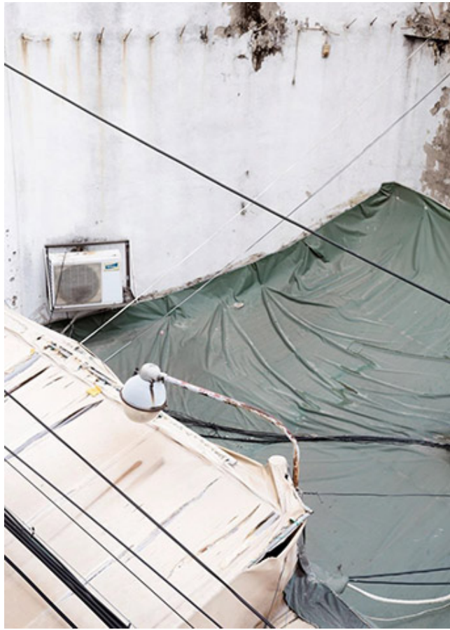
000 000 #54_Printed on wallpaper_3cm 000 0 0_99x138.6cm_2018