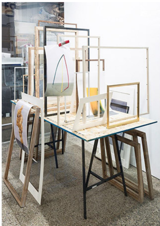
«Leaving Independent» 2018

Q. 2018年「Leaving Independent」展覧会について、感想を述べてください。