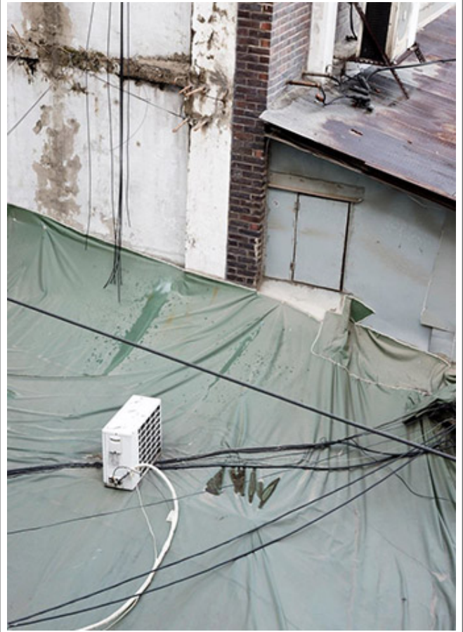
000 000 #55_Printed on wallpaper_000 000 00 0 0_88x123cm_2018