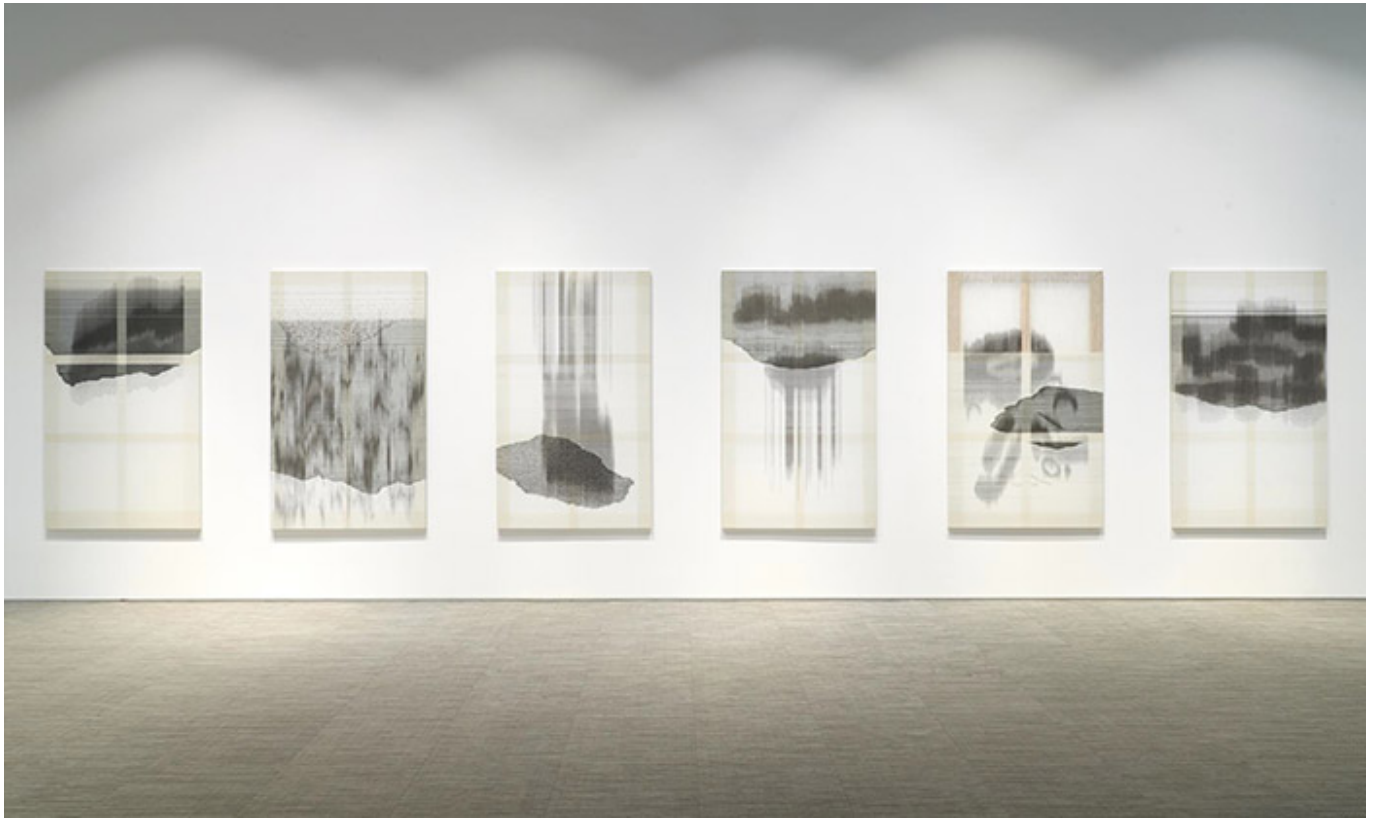
TwillStain)-5,9,7,10,6,8_Hairy Fairy Stain 2017

이 작품은 'TwillStain' 시리즈의 일부로, 다양한 직조 패턴과 색상을 사용하여 시각적 효과를 극대화했습니다. 작품은 직조된 직물 조각으로 구성되어 있으며, 각각 독특한 패턴과 색상을 가지고 있습니다. 이 작품은 직조된 직물의 질감과 색상을 강조하며, 시각적 효과를 극대화합니다. 작품은 직조된 직물 조각으로 구성되어 있으며, 각각 독특한 패턴과 색상을 가지고 있습니다. 이 작품은 직조된 직물의 질감과 색상을 강조하며, 시각적 효과를 극대화합니다.