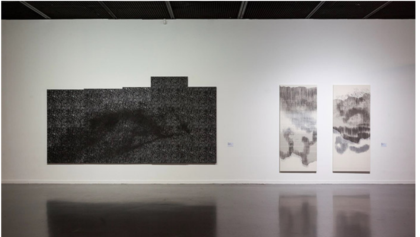
0000 000(with left, with warp) 00 00_00000000_2018