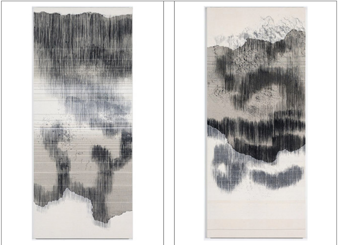
TwillStain)-20, 21_cotton yarn, polyester yarn, dye_227×97cm_2018