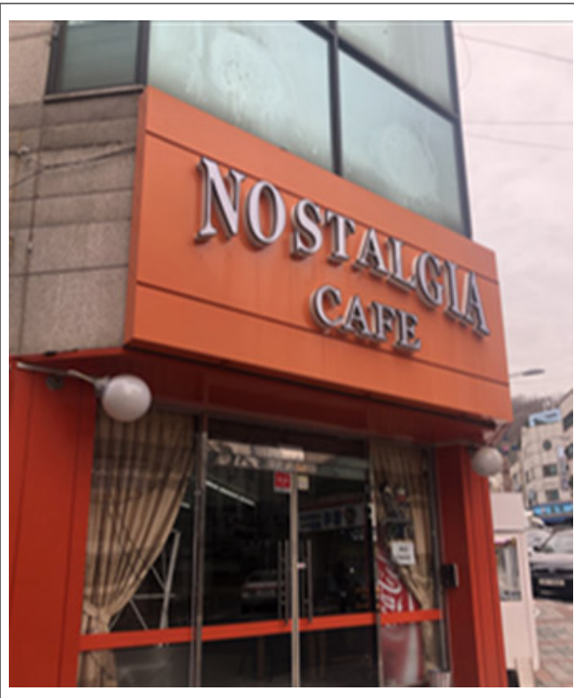
· / (, Park Bong Su) , ,