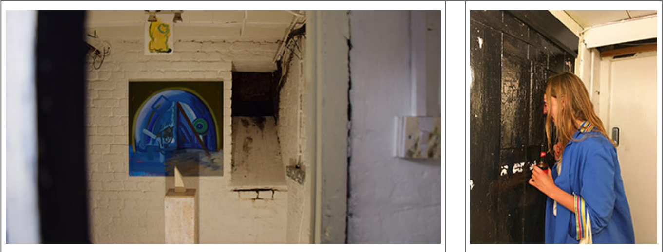
Finding a Triangle Through a Square _Oil on canvas, plaster, light, wooden plinth, Dimensions variable_2018