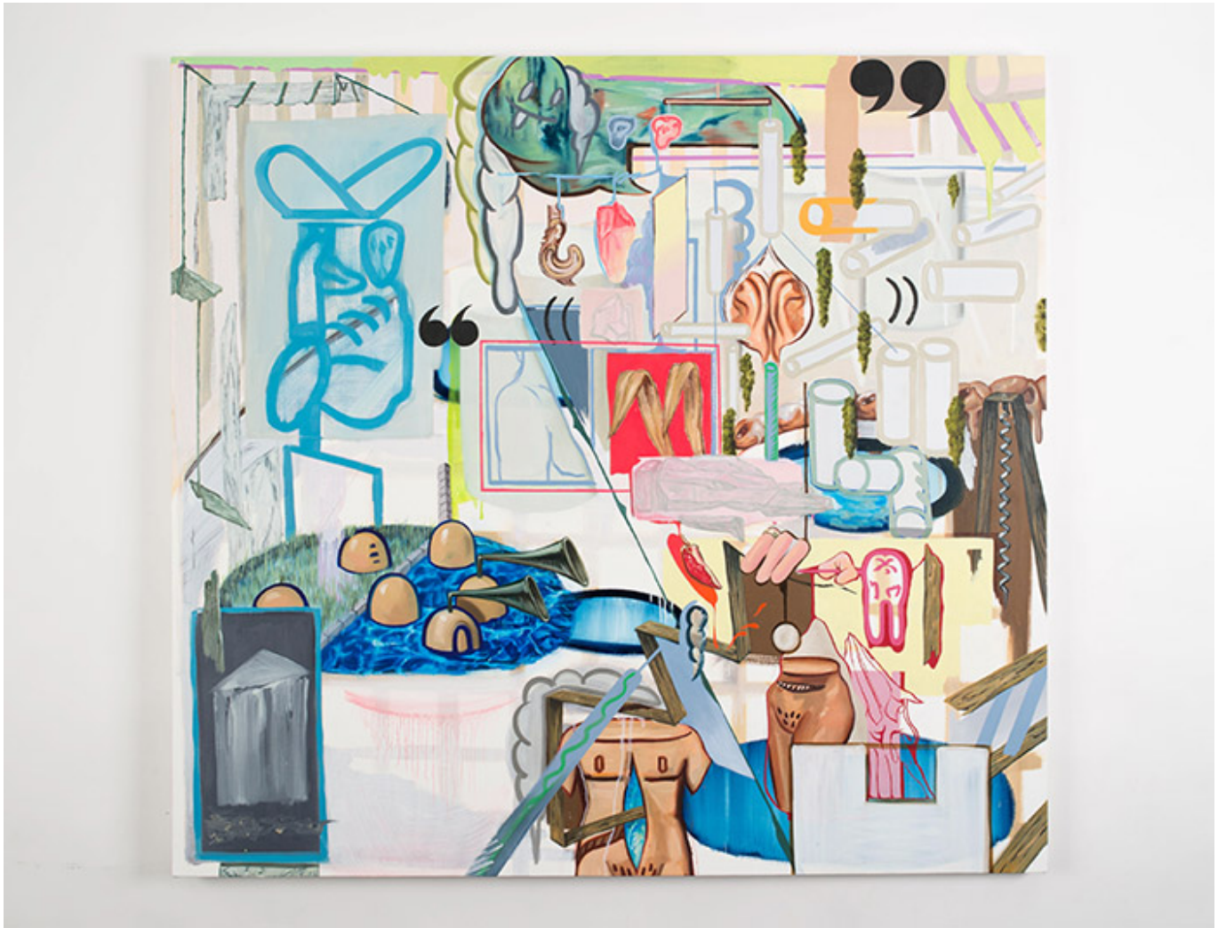
For You Who Do Not Listen to Me_oil on canvas_140x150cm_2017

Q. 請就這幅畫作《你不聽我說話》(For You Who Do Not Listen to Me) 進行分析與評論?