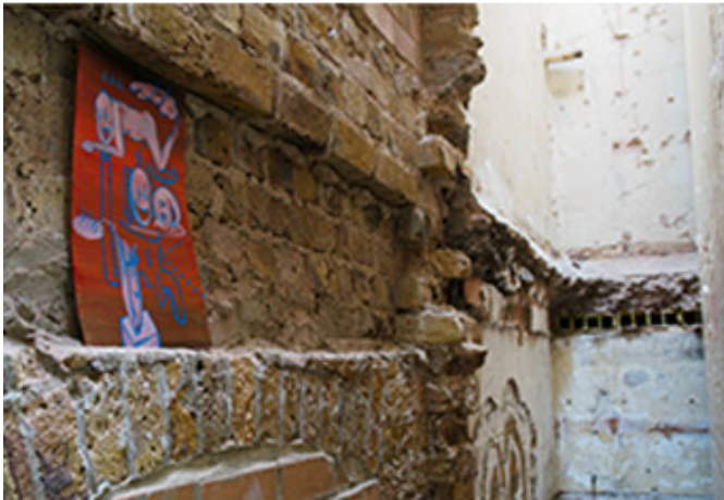
New Paintings_Installation view at SIDE ROOM Gallery_London_2017