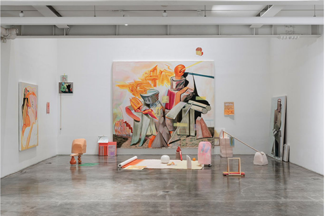
A Meeting Place_Oil on canvas, oil on paper, wrapped painting, glazed ceramic, wood, sponge, plaster, paper tape, orange, acrylic tube, clay, toy, wooden frame, Dimensions variable_Songeun Art Space_2017-2018