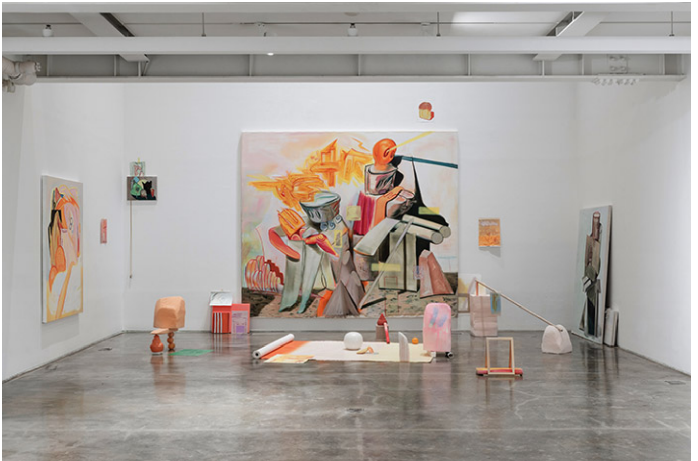
A Meeting Place _Oil on canvas, oil on paper, wrapped painting, glazed ceramic, wood, sponge, plaster, paper tape, orange, acrylic tube, clay, toy, wooden frame, Dimensions variable_Songeun Art Space_2017-2018