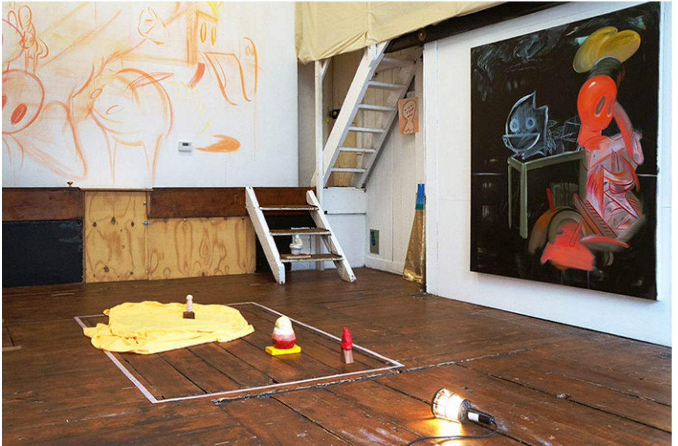
A Meeting Place _Installation view at Madame Lillie gallery, London_2017