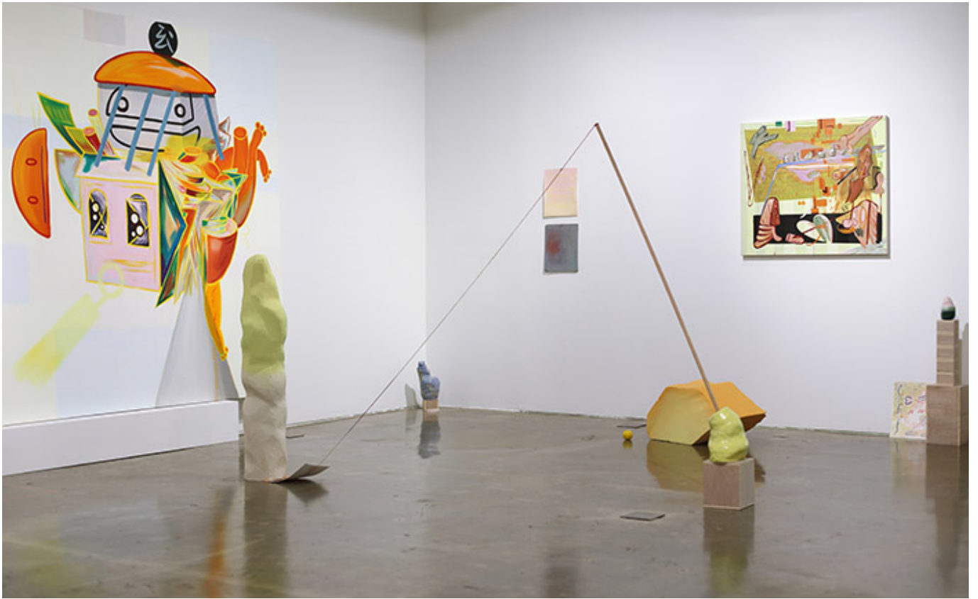
A Pretty Face_Oil on canvas, oil on paper, wrapped painting, glazed ceramic, plaster, paper tape, orange, spray on thread, clay, wooden stick, Dimensions variable_Songun Art Space_2018