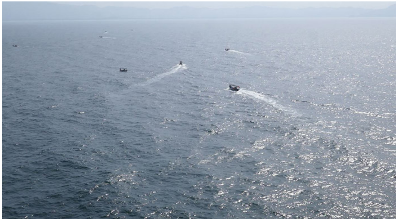
የህዝብ ግንባታ ላይ ጥቅም ላይ ያውጥታል።

በህዝብ ግንባታ ላይ ጥቅም ላይ ያውጥታል። ይህ ስራ የሚከተለውን ዓይነት ጥቅም ያሰጣል።