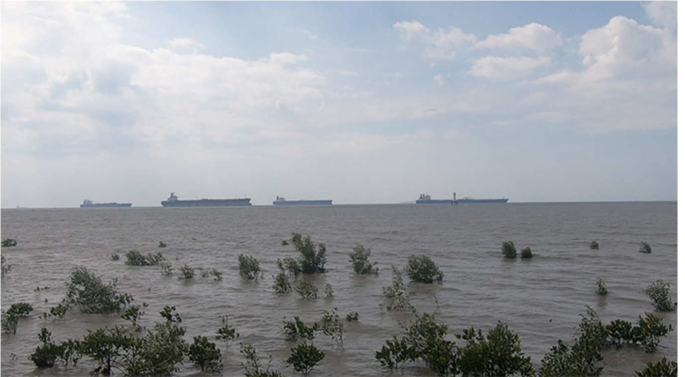
Figure 1. Aerial view of the mangrove forest in the coastal area.

The mangrove forest in the coastal area is a vital ecosystem that provides numerous benefits to the environment and the local community. It acts as a natural barrier against storms and tsunamis, protecting the land and the people living in the coastal areas. The mangrove forest also plays a crucial role in carbon sequestration, storing large amounts of carbon in the soil and the plants. This helps to mitigate climate change by reducing the amount of carbon dioxide in the atmosphere. Additionally, the mangrove forest provides a habitat for a variety of species, including fish, birds, and other marine life. This makes it an important area for conservation and sustainable management. The mangrove forest is also a source of income for the local community, as it provides a source of timber and other products. Therefore, it is essential to protect and restore the mangrove forest to ensure the sustainability of the coastal ecosystem and the well-being of the local community.