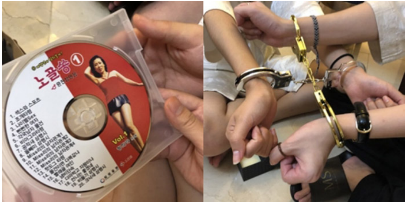
이들 A씨는 '노필승 1'을 출판: MNB

이들 중 일부는 이 사건과 관련해 다른 사건도 수감된 것으로 알려졌다. 이 사건은 2018년 11월 15일 서울 서초구 소재 한 아파트에서 발생한 것으로, 피해자는 당시 20대 초반의 여성이었다.