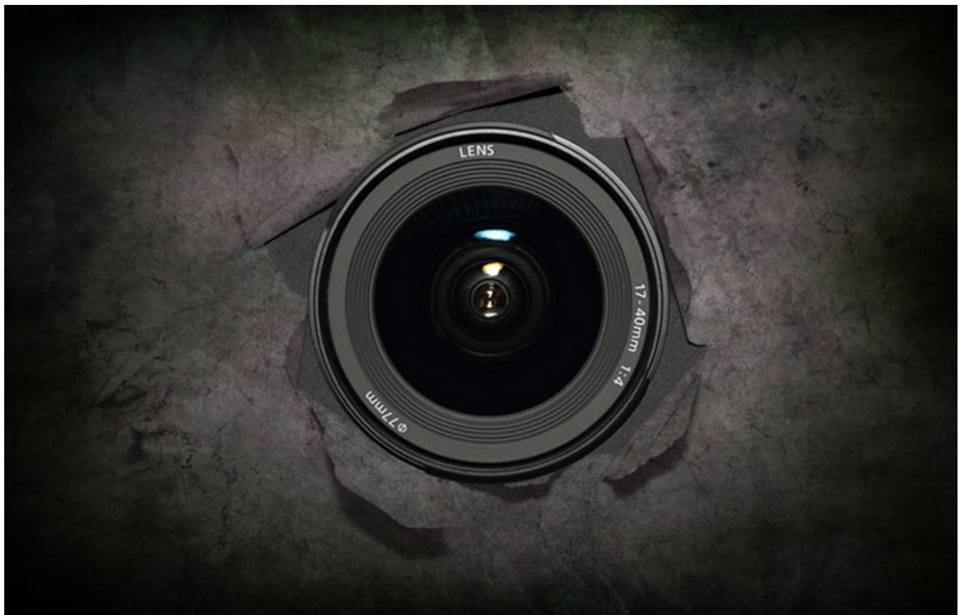
2008년 10월 10일

A. 옳다. 2008년 10월 10일은 '2008년 10월 10일'에 대한 설명이 옳은지 옳지 않은지 설명하시오.