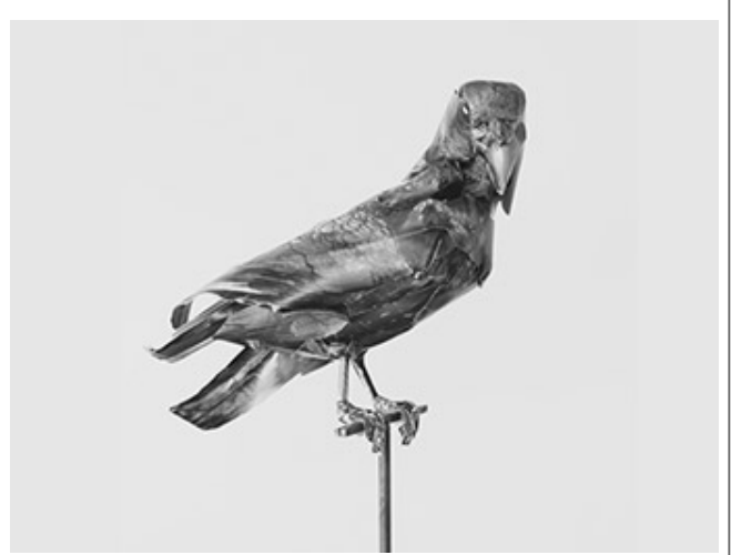
미니멀리즘 #3_Pigment Print_120x190cm_2018