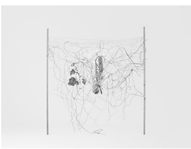
미니멀리즘 5_Pigment Print_105x140cm_2018

A. 미니멀리즘은 1960년대 미국에서 발생한 미술 운동으로, 형태와 색채를 최소화하여 사물의 본질을 표현하는 데 중점을 둔다. 이 운동의 선구자 중 한 명인 워alker 에번스(Walker Evans, 1903~1975)는 '미니멀리즘'을 통해 사물의 본질을 표현하는 데 기여했다. 미니멀리즘은 1960년대 이후 미술계의 주요 흐름 중 하나인 '미니멀리즘'의 특징을 설명하시오. 이 운동의 선구자 중 한 명인 워alker 에번스(Walker Evans, 1903~1975)는 '미니멀리즘'을 통해 사물의 본질을 표현하는 데 기여했다.