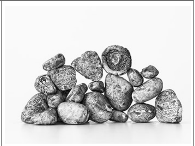
작품 #9_Pigment Print_105x135cm_2015

이 작품은 자연에서 채취한 돌과 돌 조각을 사용하여 제작되었습니다. 돌은 돌을 쌓아 올리거나 무너뜨리는 과정과 관련이 있습니다. 돌은 자연에서 발견되는 다양한 형태와 크기의 돌 조각으로 구성되어 있습니다. 이 작품은 안톤 파블로비치 체코프(Anton Pavlovich Chekhov, 1860~1904)의 작품인 '돌'을 모티브로 제작되었습니다. 이 작품은 돌을 쌓아 올리거나 무너뜨리는 과정과 관련이 있습니다.