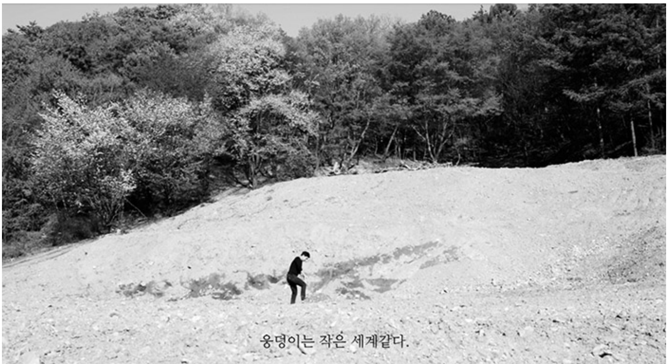
000 #000 00_50 50_000 000000_2015 (00 : https://vimeo.com/187106904 )

이 00 00 <00>0 00 0000 00 00 00 0 0, 0000 00000 0000 0000 0000 0000 00000. 0 000 0000 00 00 000 0000 000 00, 000 000 0000 00 0 00 00 000 00 00 00. 00 0 00 0 000 00 000 000 000 000 000000 00. 00 00 00 0000 00 000000 0000 0000 0000. 000 00 000 00 00 000 0 000 00, 0 00 000, 000 00 000 00 0000 0000 000 000, 0 0000 00 0? 000 00 00 000 0000, 000 0000 000 000? 00 00 0000 00 0000 00.