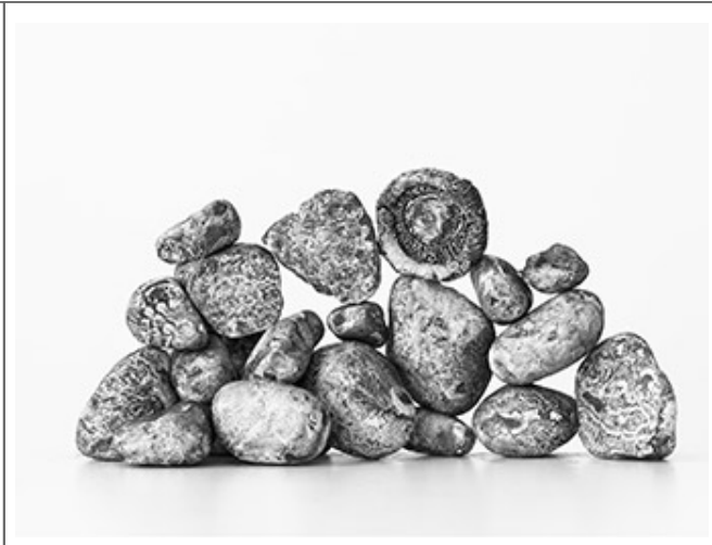
작품 #9_Pigment Print_105x135cm_2015

이 작품은 자연에서 발견된 돌과 같은 재료로 제작되었습니다. 돌은 시간과 환경에 따라 다양한 형태와 질감을 띠며, 이는 예술가의 상상력과 창의성을 자극합니다. 또한, 돌은 문화와 역사의 흔적을 담고 있으며, 이는 작품에 깊이와 무게를 부여합니다. 이 작품은 Anton Pavlovich Chekhov (1860~1904)의 문학적 세계를 반영하며, 그의 작품에서 발견되는 미묘한 감성과 인간적 통찰을 시각적으로 표현합니다.