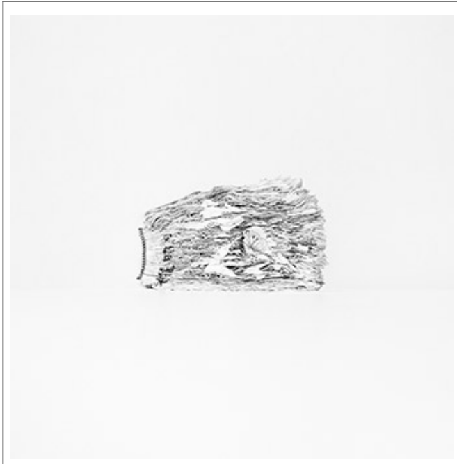
000 00 - 110_Pigment print_105x105cm_2014