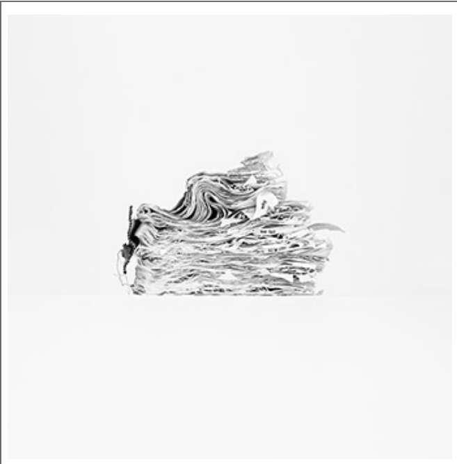
000 00 - 00_Pigment print_105x105cm_2014

이 00 00 <00>0 00 0000 00 00 00 0 0, 0000 00000 0000 0000 0000 0000 00000. 0 000 0000 00 00 000 0000 000 00, 000 000 0000 00 0 00 00 000 00 00 00. 00 0 00 0 000 00 000 000 000 000 000000 00. 00 00 00 0000 00 000000 0000 0000 0000. 000 00 000 00 00 000 0 000 00, 0 00 000, 000 00 000 00 0000 0000 000 000, 0 0000 00 0? 000 00 00 000 0000, 000 0000 000 000? 00 00 0000 00 0000 00.