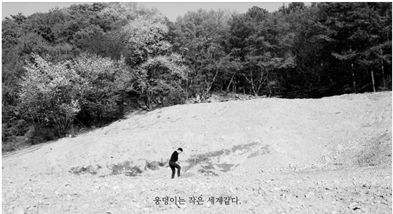
웅덩이는 작은 세계같다.

이 사진은 <00>의 사진 시리즈의 일부로, 0000 00000 0000 0000 0000 0000 00000. 이 사진 시리즈는 00 00 000 0000 0000 00, 000 000 0000 00 0 00 00 000 00 00 00. 00 0 00 0 000 00 000 000 000 000 000000 00. 00 00 00 0000 00 000000 0000 0000 0000. 000 00 000 00 00 000 0 000 00, 0 00 000, 000 00 000 00 0000 0000 000 000, 0 0000 00 0? 000 00 00 000 0000, 000 0000 000 000? 00 00 0000 00 0000 00.