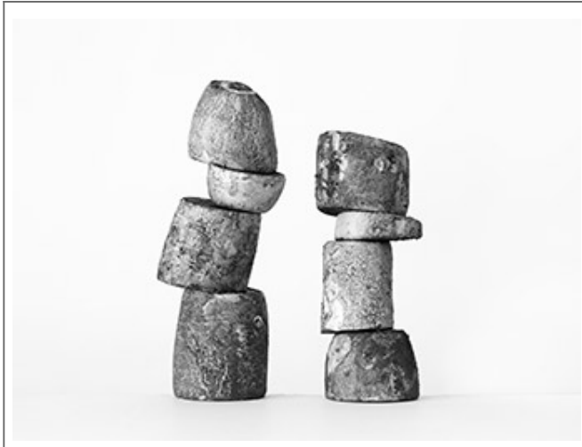
작품 #4_Pigment Print_105x135cm_2015