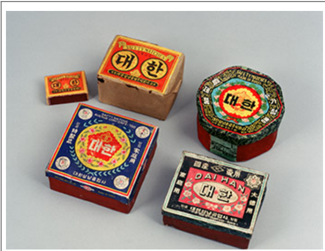
(005) 대한 담배의 종류

이 책은 1950년대부터 1960년대까지의 대한 담배를 소개하고 있다. 이 책은 담배의 종류, 디자인, 그리고 역사에 대해 자세히 설명하고 있다. 1950년대에는 대한 담배가 가장 인기 있는 담배였으며, 1960년대에는 대한 담배가 10위권 안에 들어갔다. 이 책은 담배의 디자인과 포장에 대해 자세히 설명하고 있다. 또한 담배의 역사와 문화에 대해서도 설명하고 있다. 이 책은 담배 애호가들에게 유용한 정보가 될 것이다.