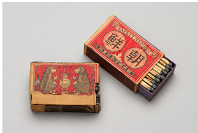
(04) 日本製紙(株) 和紙 輸出 開始

1938年、日本が初めて海外に輸出した商品は、 日本製紙 の 和紙 である。和紙は、古くから日本で作られてきた紙で、その特徴は繊維が長く、丈夫で、また、独特の美しさがある。和紙は、日本文化の象徴として、海外にも広く知られるようになった。