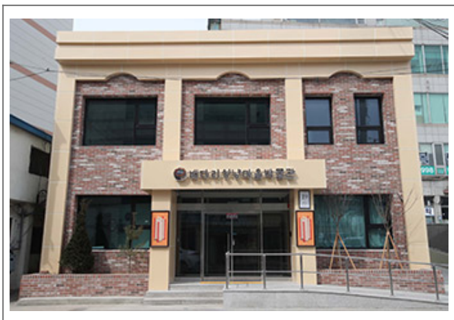
(○○1) ○○○○○○○○○○○ ○○

2018년 ○○○, ○○○○○○○○ ○○○○○○○○○○ ‘2019 ○○○ ○○○ ○’○○ ○○○○○ ○○○ ○○○ ○○○○○. ○○○○○ ○○○○○○ ○○○○○ ○○○ ○○○ ○○○○○○○○○ ○ ○○○○○○, ○○○ ○○○○ ○○○ ○○○ ○○○ ○○○ 1○○ ○ ○○○○○○○ ○○○ ○○○ ○○○○○. ○○○ ○○○○○○○○○○○ ○○○ ○○○ ‘○○ ○○○○! ○○○○○○○’○○○○ ○○○ ○○○ ○○○ ○○○○○ ○○○, ○○○○○○ ○○○ ○○○ ○○○ ○○○○○ ○○○ ○○○○○. ○○○ ○○○ ○○○ ○○○○○ ○○○ ○○○○○○○○○○○○○○○○○○○○○ 2019년 3월 ○○○○○.