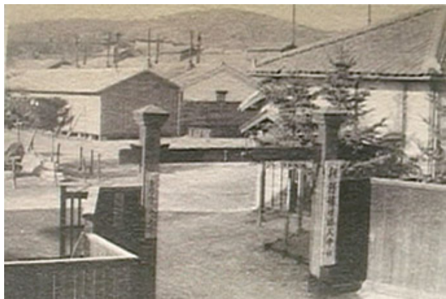
(03) 日本製紙(株) 和紙 輸出 開始

1917年、日本が初めて海外に輸出した商品は、 日本製紙 の 和紙 である。和紙は、古くから日本で作られてきた紙で、その特徴は繊維が長く、丈夫で、また、独特の美しさがある。和紙は、日本文化の象徴として、海外にも広く知られるようになった。