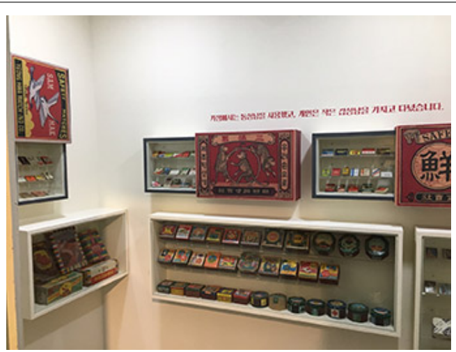
(006) 대한 담배의 다양한 디자인을 소개하는 전시

이 책은 1950년대부터 1960년대까지의 대한 담배를 소개하고 있다. 이 시기에 대한 담배는 10여종의 다양한 맛과 디자인으로 인기를 끌었다. 이 책은 대한 담배의 역사와 디자인을 소개하고 있다. 이 책은 대한 담배의 역사와 디자인을 소개하고 있다. 이 책은 대한 담배의 역사와 디자인을 소개하고 있다.