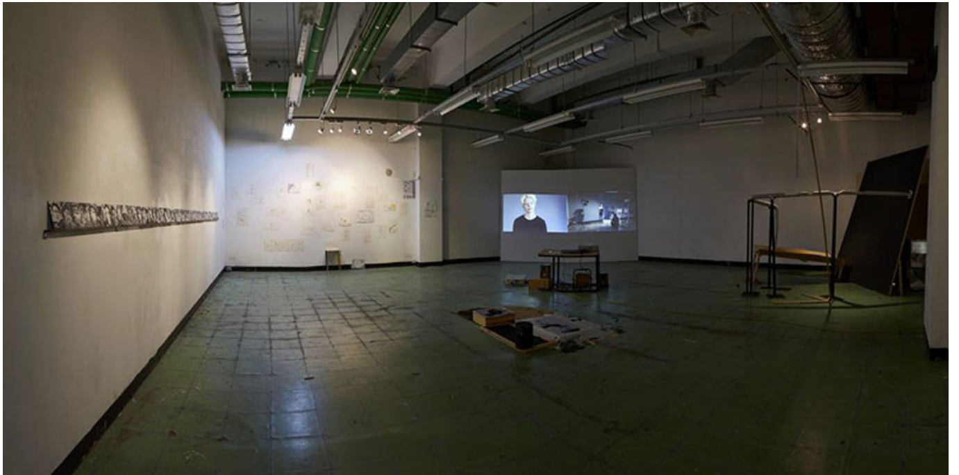
<실험 영상(Strange Reversible Reaction)> 박지현_B104, 2014

Q. 이 작품은 어떤 매체로 제작되었는지, 그리고 어떤 주제를 다루고 있는지를 설명하십시오.