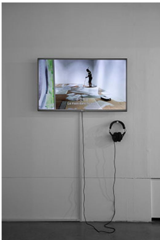
<2018 臺北 國際音響節> 音響節 音 節_音響 音響, 30日, 2018