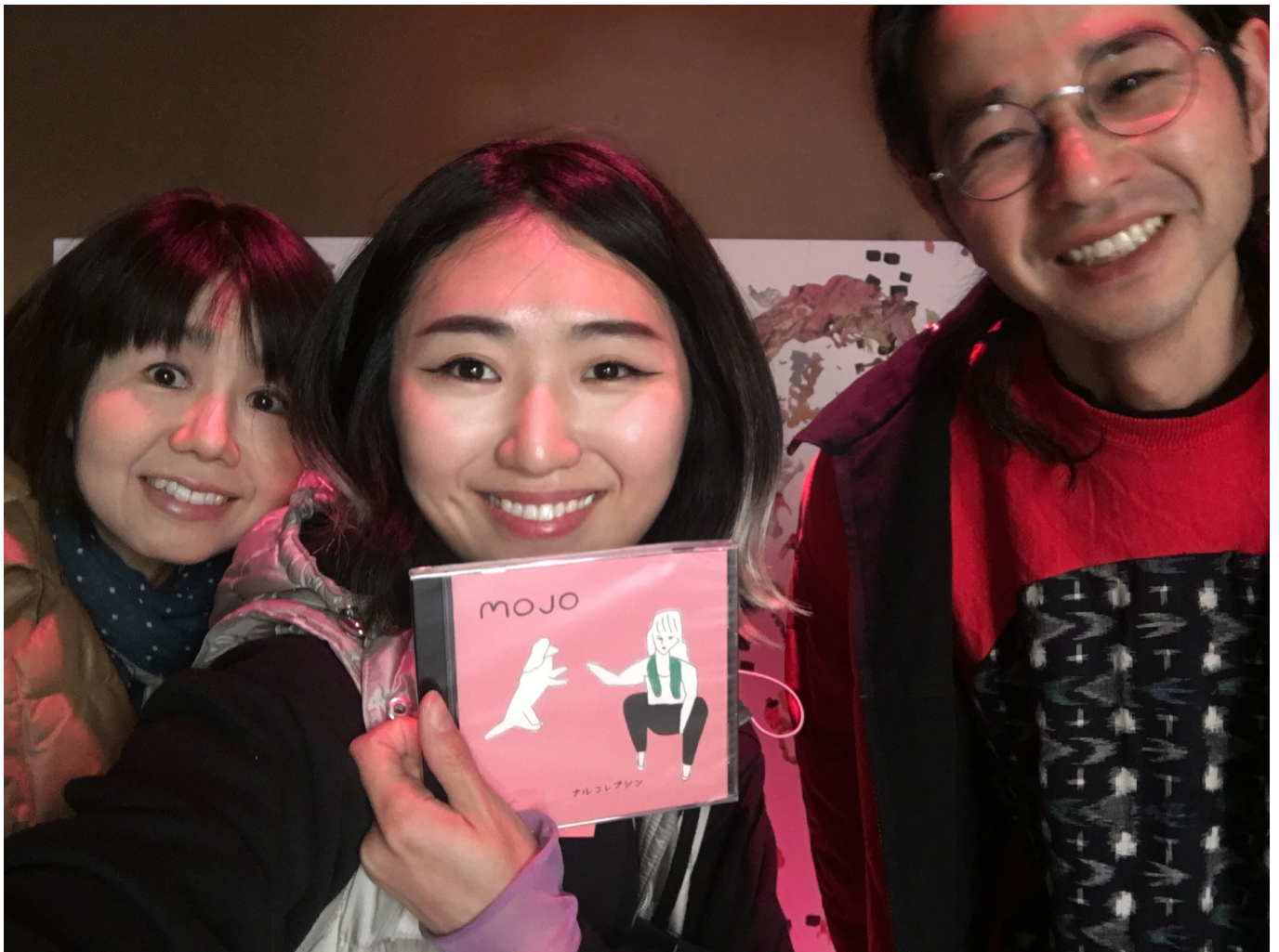
Yaloo Castle Site at Fukuoka Narukorepusinn イベントの様子

このイベントは、和紙の魅力を伝えるだけでなく、和紙の歴史や文化についても学ぶことができました。会場には、和紙の歴史や文化について学ぶための展示やワークショップが行われていました。特に、和紙を使ったワークショップが人気で、多くの方が参加していました。また、和紙の歴史や文化について学ぶことができました。このイベントを通じて、和紙の魅力を再発見することができました。