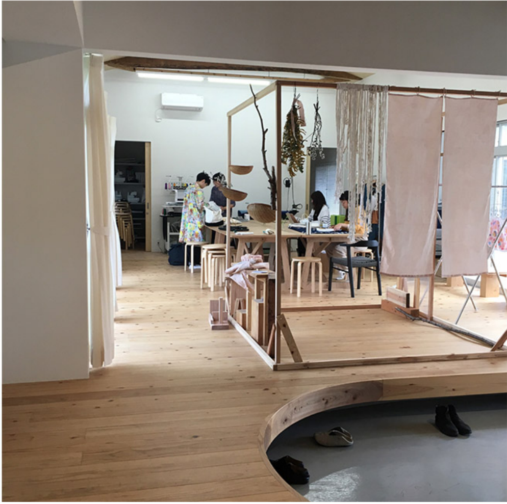
京都府京都市中京区にある「京の織物」の工房

京都府京都市中京区にある「京の織物」の工房。ここでは、伝統的な京の織物を制作しています。工房には、多くの織機が並び、職人たちが丁寧に織物を制作しています。また、工房には、多くの織物があり、お客様にご覧いただけます。ぜひ、工房へお越しください。