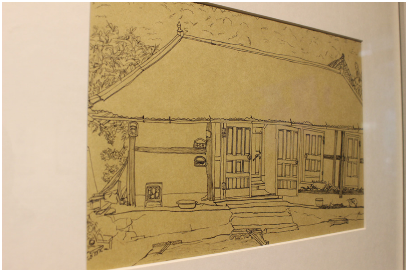
국: 0000 000

00 000000 000 '0000 0 000' 0 000 000000 00 0 00 000 000 000 0000 000 000 0000. 00000000 000 00 00 00 000 000 000 0000 000 0 00 000 000 0 000 000 000.