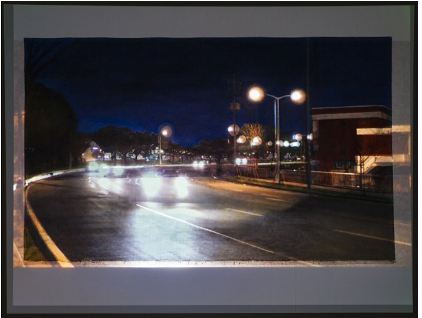
00000_VTR, acrylic on canvas, liquid-crystal projector, DVD player_2015