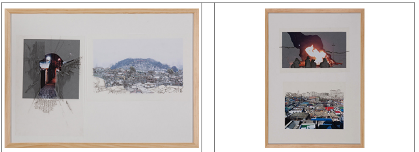
Korean Scenery (Daejeon City scene) _digital print, pencil on tracing paper, wood frame_17.8×51.5cm_2018

A. 00 000 00 000 000 000 00 000000 00000 000 00 00.