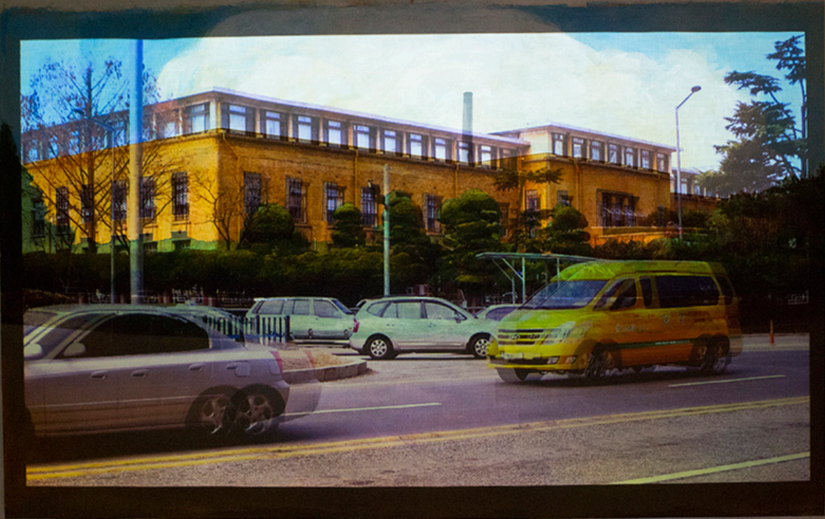
Old Chungnam Provincial office_VTR, canvas on acrylic paint, projector, SD player, video installation_220×130㎝_2018