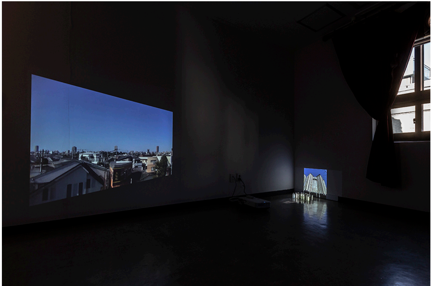
Korean Sceneries _Video installation_OPEN STUDIO View at Incheon Art Platform_2018

A. 이 작품은 도시의 다양한 풍경과 건축을 보여줍니다. '도시'라는 주제를 통해 현대 도시의 변화와 발전을 탐구합니다. 작품은 도시의 다양한 층위를 보여줌으로써, 도시의 복잡성과 다양성을 강조합니다. 또한, 도시의 발전과 함께 발생하는 사회적 문제와 환경 문제를 암시적으로 드러내며, 도시의 미래를 고민하게 합니다. 이 작품은 도시의 현재와 미래를 연결하는 다리 역할을 하며, 도시의 가치를 재조명하고, 도시의 미래를 위한 고민을 촉구합니다.