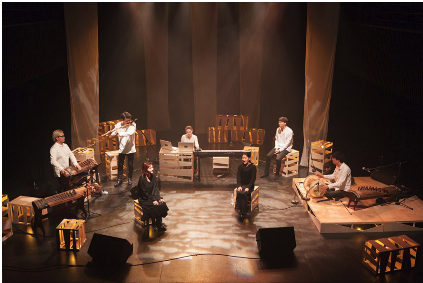
<〇〇〇 〇 〇〇〇〇>_2017

Arnalds) 〇〇 〇〇〇〇 〇〇〇〇 〇〇〇 〇〇〇〇 〇〇〇〇 〇 〇〇〇 〇〇 〇〇〇〇 〇〇〇 〇 〇〇. 〇〇 〇〇〇 〇〇〇 〇 〇〇〇〇 〇〇 〇〇〇〇 〇〇〇〇 〇〇〇 〇 〇〇〇 〇〇 〇〇.