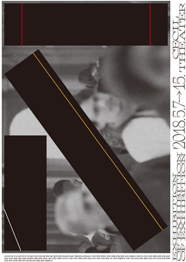
「Exhibition of Exhibition of Exhibition」, 2018