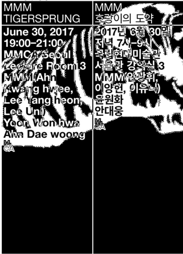
<한국어 버전(www.tigersprung.org)>, 2017년 6월 30일, 서울