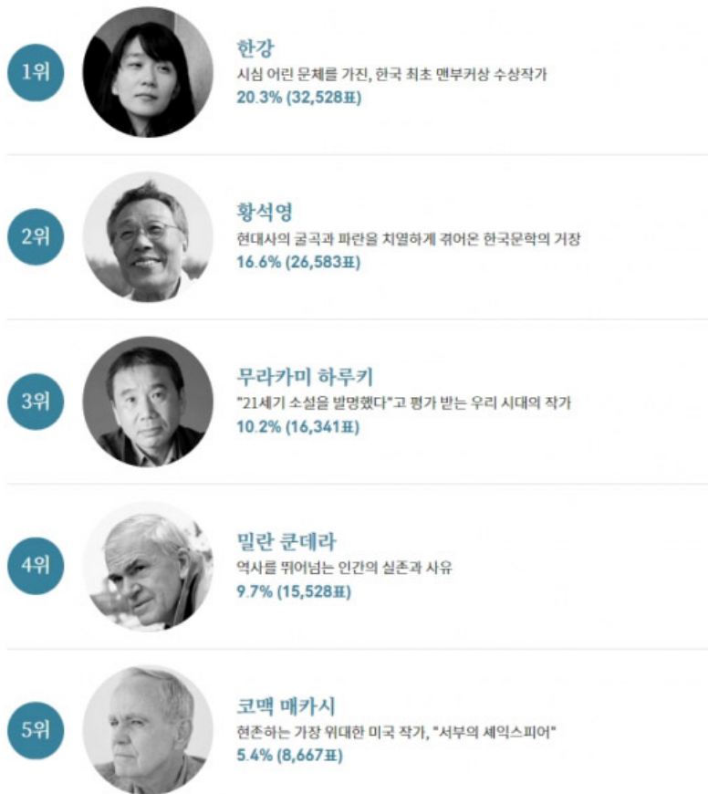
표 : 표

표표 표표 표표24 표표 1~10 표표표 표표표 '2018 표표표표 표표' 표표표 표표 표표 표표표표. 표 16표17표표 표표 표표 표표 표표표 표표 3표2528표(20.3%) 표 1표 표표표 표표. 2표 <표표표표표>, <표표표> 표표 표표, 3표표 5표 표 <표표표 표표> 표표표 표표(10.2%), <표표 표 표표 표표> 표표 표표(9.7%), <표표> 표표 표표 표(5.4%) 표표.