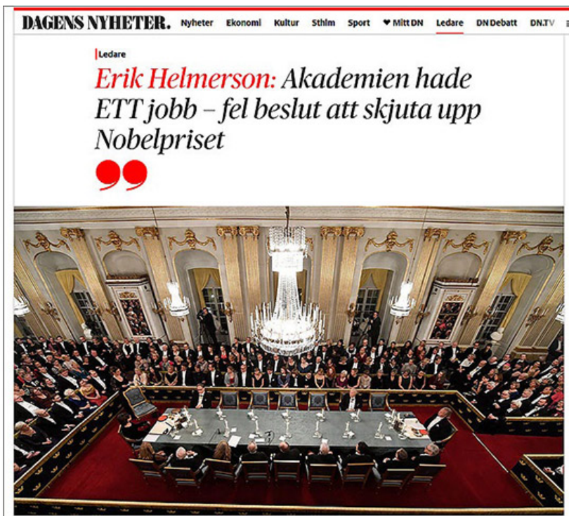
5 4 :

1914, 1918, 1935, 1940, 1943 1, 2 1958 1964 "