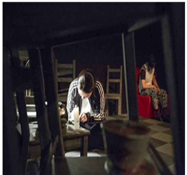
<비오는 새>_인천_아트플랫폼 2017