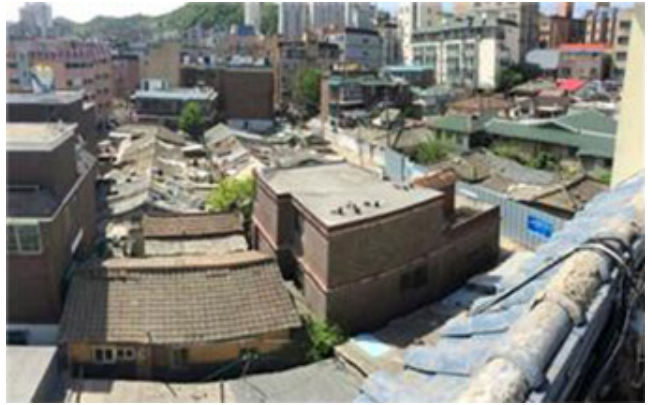
11월 11일 (2016년 11월)