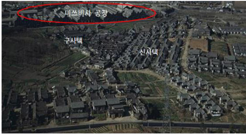
1948년 마을 모습

이 회사는 1948년 이후 전 세계적으로 다양한 산업 분야에 진출하며 글로벌 리더로 자리매김했습니다. 이 회사는 2002년 이후에는 전 세계적으로 다양한 산업 분야에 진출하며 글로벌 리더로 자리매김했습니다.