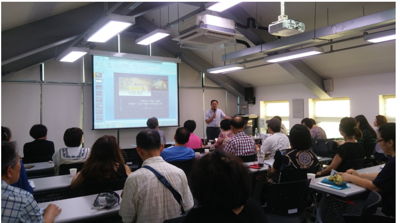
<한국사 14대기 상인들 '신과 이혼을 위하여'> 김민호 ©2014

한국사 14대기 상인들 '신과 이혼을 위하여', 김민호 지음, 한국학중앙연구원 출판부, 2014년 12월 15일 발행, 288쪽, 14,900원. "신과 이혼을 위하여" "신과 이혼을 위하여"는 한국사 14대기 상인들 '신과 이혼을 위하여'의 14대기 상인들 '신과 이혼을 위하여'를 소개하는 책이다. 이 책은 한국사 14대기 상인들 '신과 이혼을 위하여'의 14대기 상인들 '신과 이혼을 위하여'를 소개하는 책이다. 이 책은 한국사 14대기 상인들 '신과 이혼을 위하여'의 14대기 상인들 '신과 이혼을 위하여'를 소개하는 책이다.