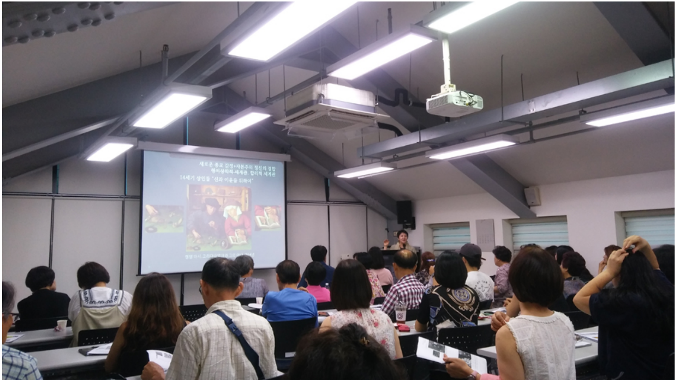
<한국사 14대기 상인들 '신과 이혼을 위하여'> 김민호 ©2014