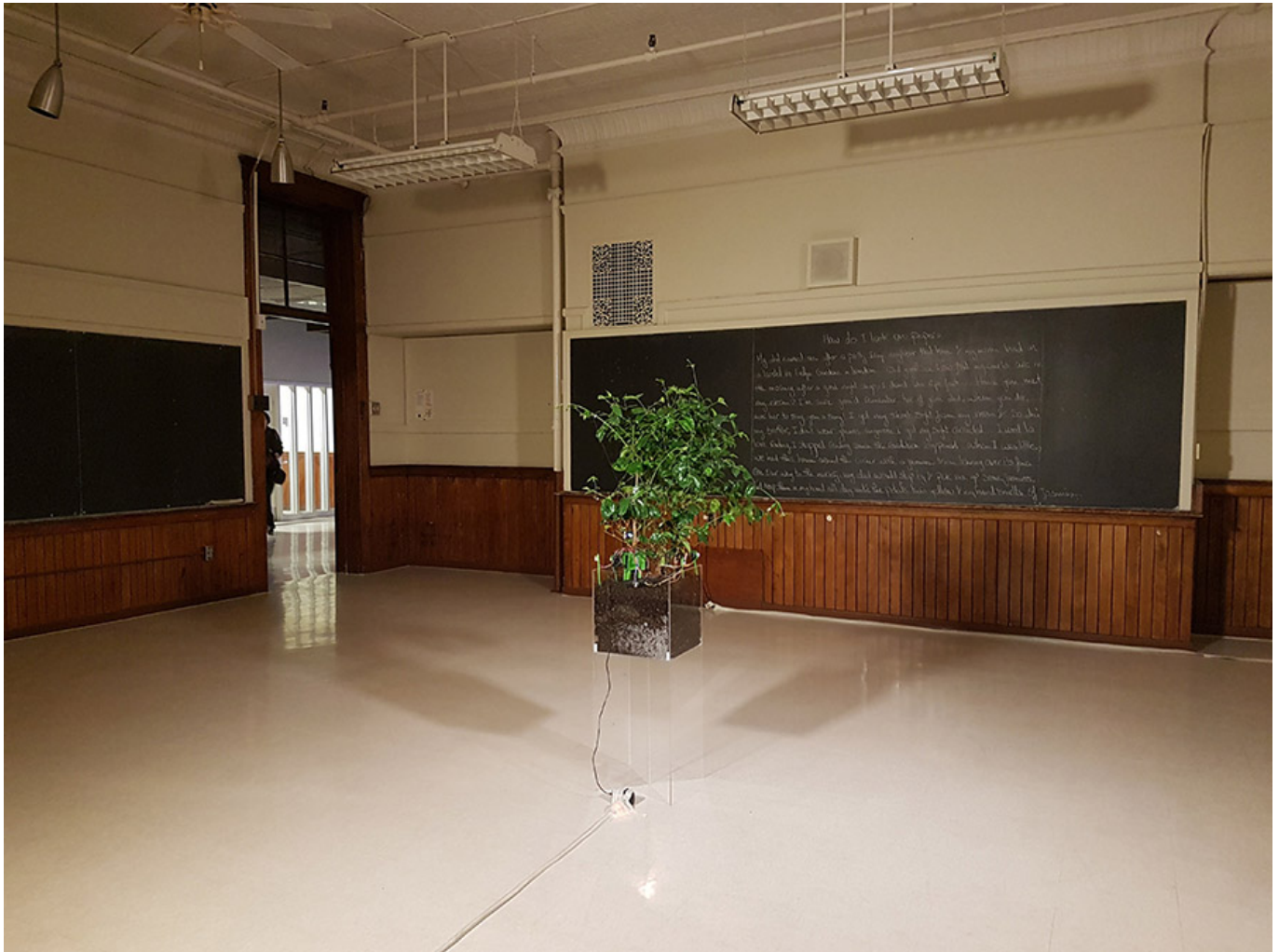
How do I look on paper? _Jasmine tree, proximity sensors, servos, fishing wire, plexiglas and Arduino_ Steam Centre, Railway City Arts Crawl, St. Thomas, Ontario, Canada

0000 000 00 000 00 0000 0000 00. 00 000000 0000 000 000 000 000 00. 00 000000 0000 0000 0000 0000 00 000. 00 00000 00000 00000 00 00, 00 000 0000 00 00 00000. 0000 000000 0000 00000 00 00000 00 000000 0000 00 00000. 00 000 00000 00 00000 0000 '00000 00 00000 00'0000 0 0 00.