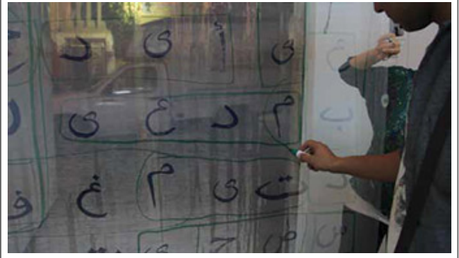
315(part 2)_230x150cm_interactive installation_2014