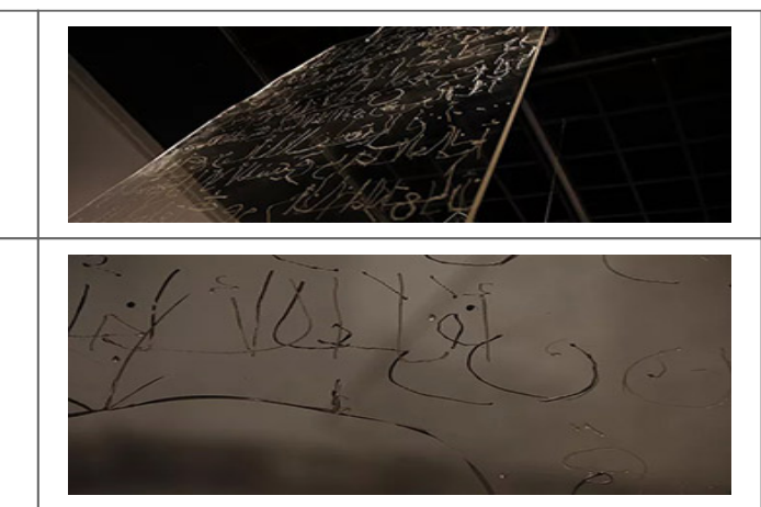
The Wall_installation_Gezira Art Center, Cairo, Egypt_2014