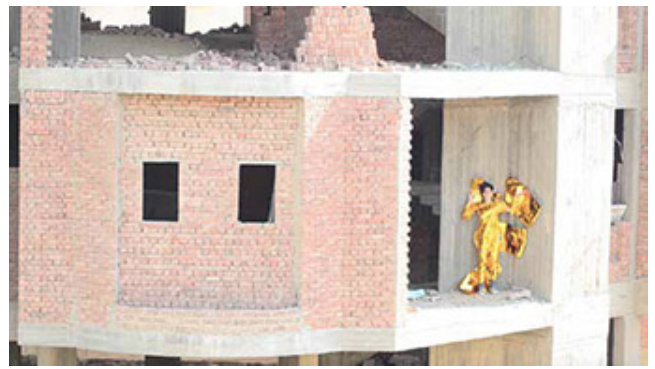
How to become transparent: a series of 6 attempts_04:20, Video performance_2015

Q. 공간, 공간 자체로서 존재하는 것이 아니라, 공간이 어떻게 사용되는가에 따라 달라진다.