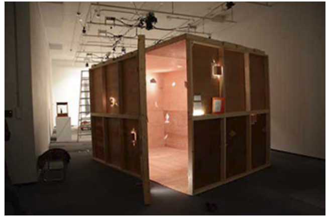
El-0da (the room)_243x243x366cm_Interactive installation_2013

이 공간은 '공간'이다. 공간은 공간 자체로서 존재하는 것이 아니라, 공간이 어떻게 사용되는가에 따라 달라진다. 이 공간은 공간 자체로서 존재하는 것이 아니라, 공간이 어떻게 사용되는가에 따라 달라진다. 이 공간은 공간 자체로서 존재하는 것이 아니라, 공간이 어떻게 사용되는가에 따라 달라진다. 이 공간은 공간 자체로서 존재하는 것이 아니라, 공간이 어떻게 사용되는가에 따라 달라진다.